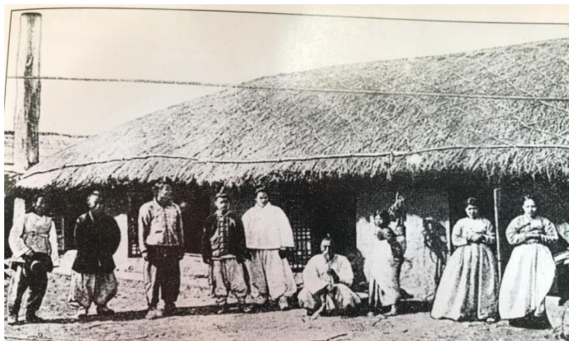
1990-е годы. Заселение корейцами регионов Дальнего Востока

Вместе с тем закон от 21 июня 1910 г., по нашему мнению, помимо определенных отрицательных последствий, имел также и положительное значение. Дело в том, что им создавались препятствия консервации низших форм наемного труда, способствуя в то же время осуществлению промышленного переворота в ведущих отраслях экономики русского Дальнего Востока [8, с. 197].