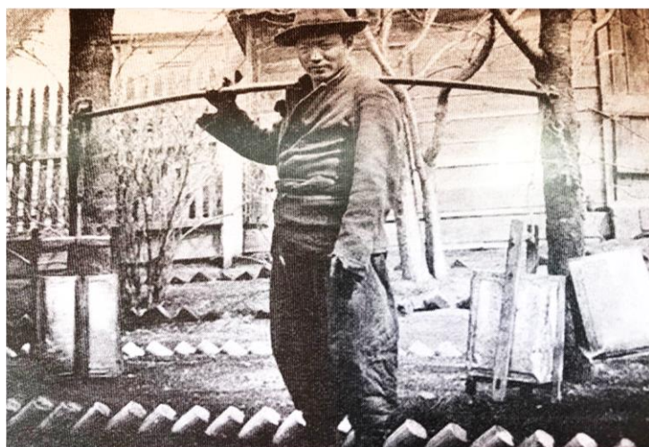
Кореец -переселенец на Дальнем Востоке 1990-е годы.