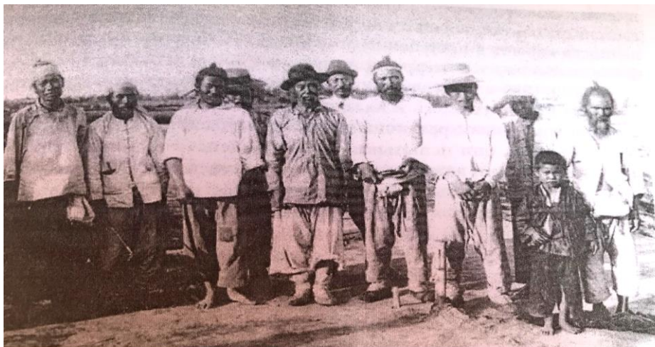
Группа корейских рабочих на строительстве Уссурийской железно дороги. Около 1896 г. Аналогичные группы создавались и для прокладки линии связи на побережье Камчатского полуострова. 1910 - 1913 гг.