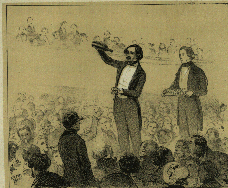
Германъ съ неистоцимою бутылкою.