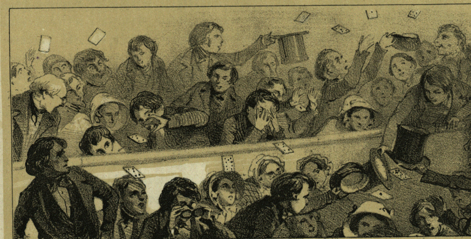
Брошенныя Германомъ карты со сцены въ раекъ, въ Большомъ Театрѣ.