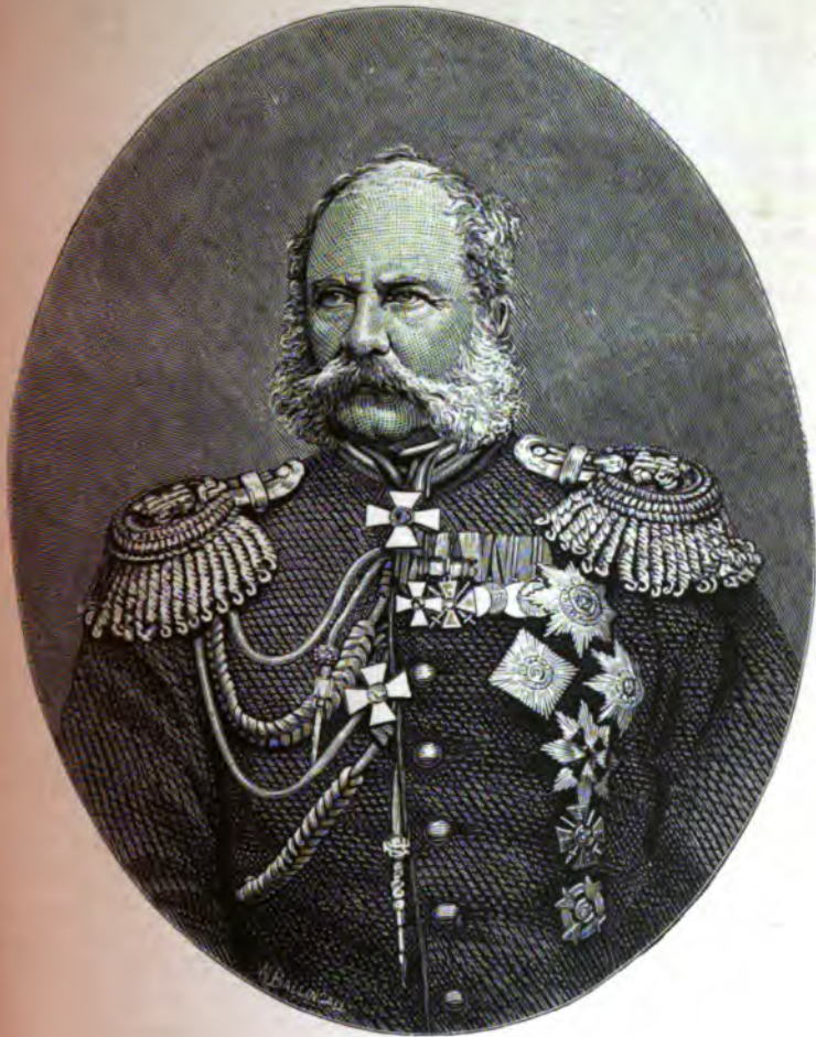
КНЯЗЬ АЛЕКСАНДРЪ ИВАНОВИЧЪ БАРЯТИНСКІЙ