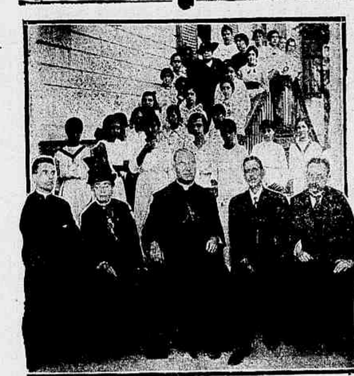
Um grupo de alunas do collegio e monsenhor Aversa, tendo ao seu lado tres membros da directoria da "Obra de Protecção"

A "Obra de Protecção ás Moças Catolicas do Brasil", benemerita instituição de caridade fundada no Collegio da Immaculada Conceição, há hontem distinguida com a visita do nuncio apostolico, monsenhor Aversa.