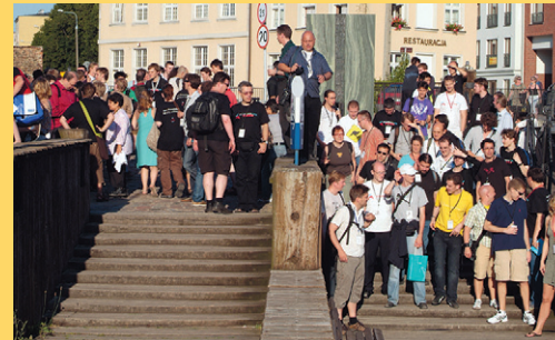
Ralf Roletschek, CC BY SA 3.0