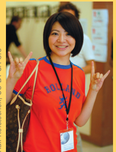
Ralf Roletschek, CC BY SA 3.0