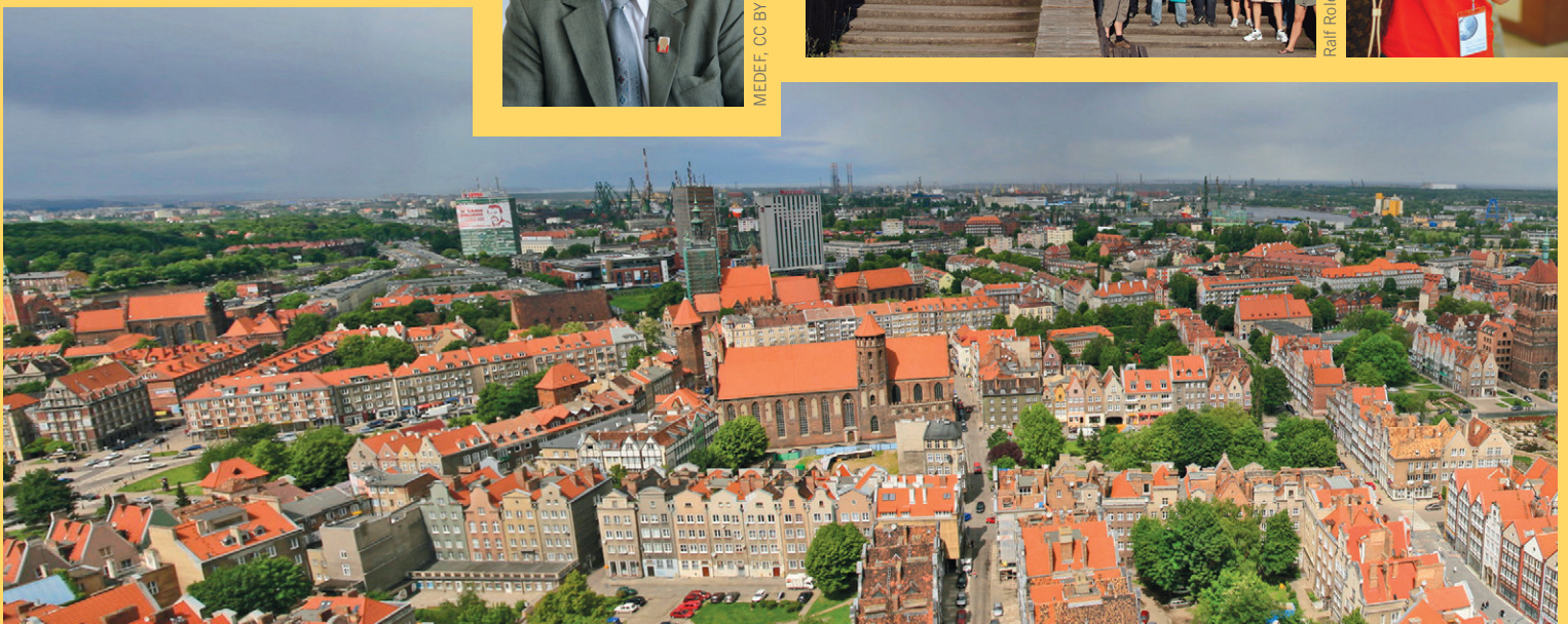
Michał Stupczewski, CC BY SA 3.0