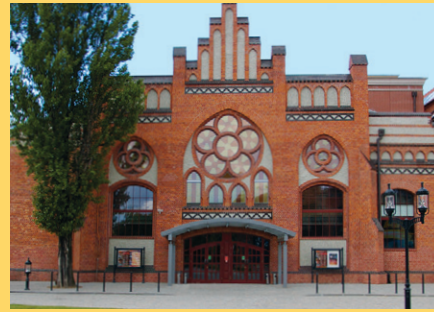
Lukasz Golowanow, CC BY SA 3.0

Nas t-shirts da conferência, o lema “Conhecimento livre na cidade da liberdade” associava os valores da Wikimedia à História de Gdansk, onde o movimento Solidariedade havia desafiado os governantes comunistas na década de 1980 - liderado por Lech Walesa, que cumprimentou os participantes na Wikimania, afirmando ser um utilizador frequente da Wikipedia.