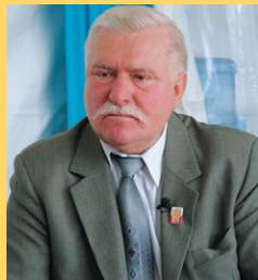
MEDEF, CC BY SA 2.0