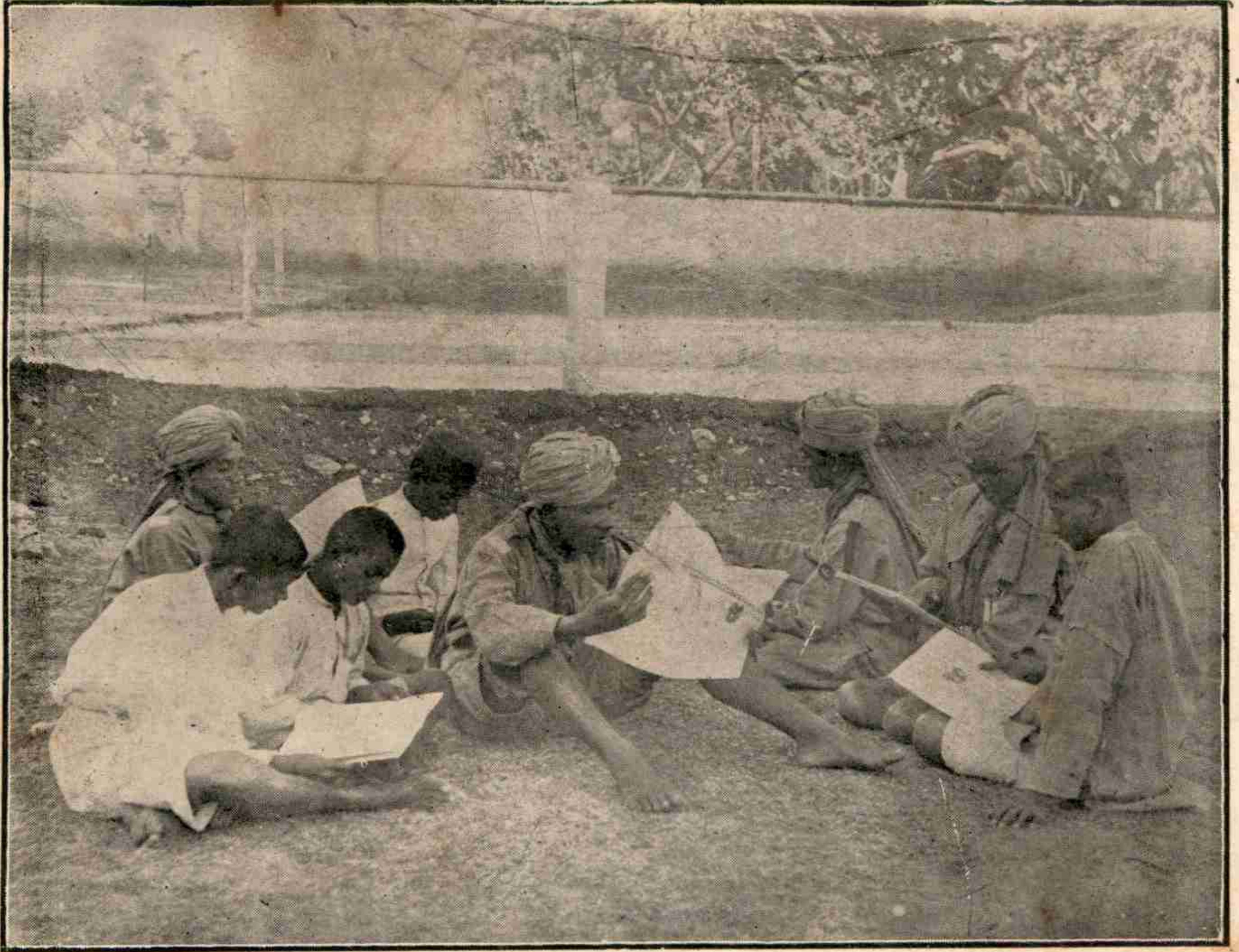
మైనూరురాష్ట్రమందలి బాలభటులు వారికై ప్రకటింపబడుచున్న బాలభటపత్రికను చదువుచుండుట.