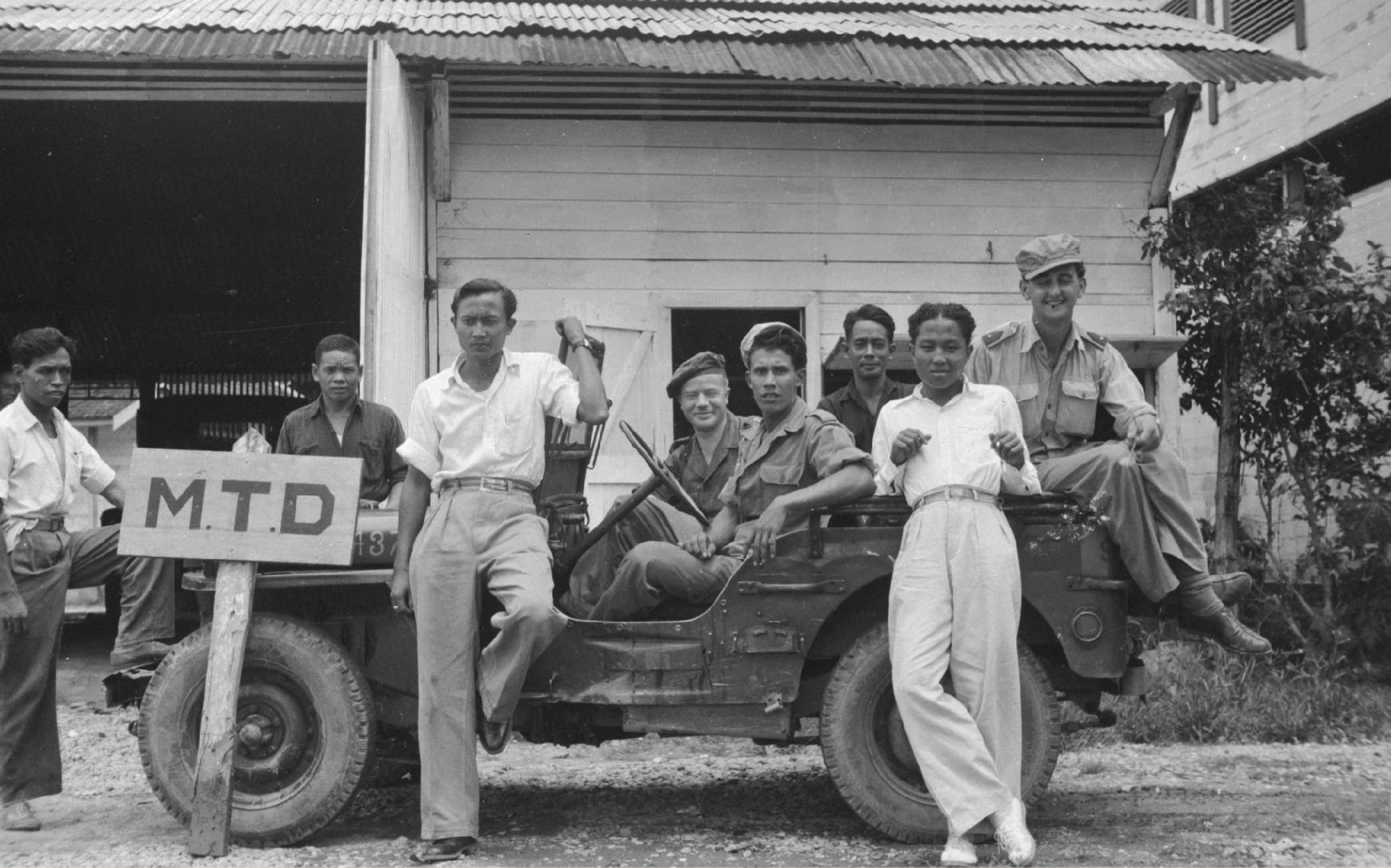
Potret Pribumi Borneo dan Tentara Belanda di Atas Mobil (1948)