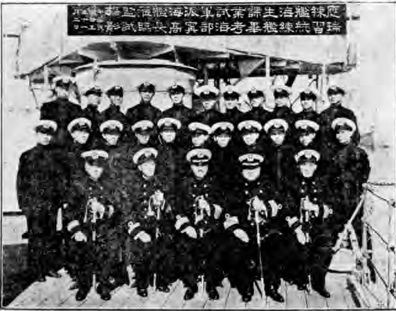
海校輪機生校課畢業合影

浙海倒蹄礁燈塔，自經設立，於航行諸多利便。惟該燈塔前因損壞，弗克放光，現經海部飭由海岸巡防處趕修，