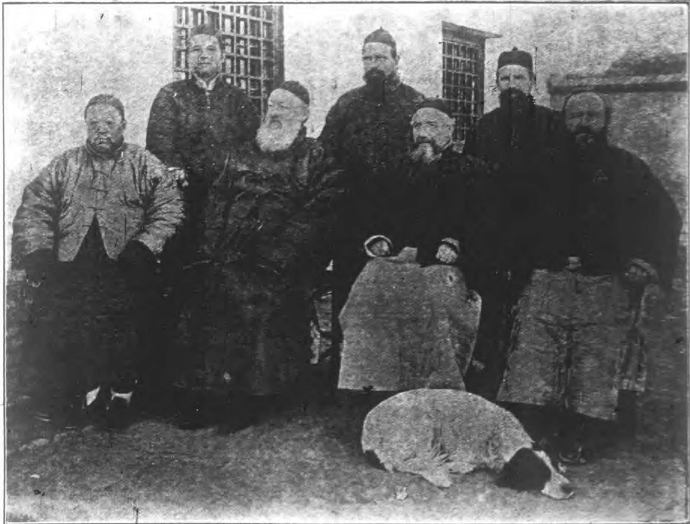
山東司法鐸來華銀慶紀念影