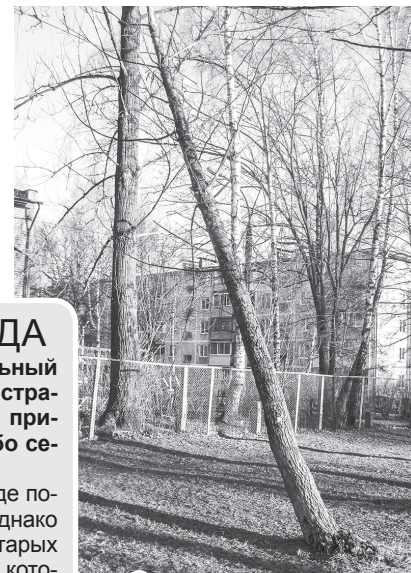
Старое высохшее дерево напротив д/с «Березка» ветер вывернул с корнем

Столько кубометров мусора было вывезено в ходе субботников 21 апреля