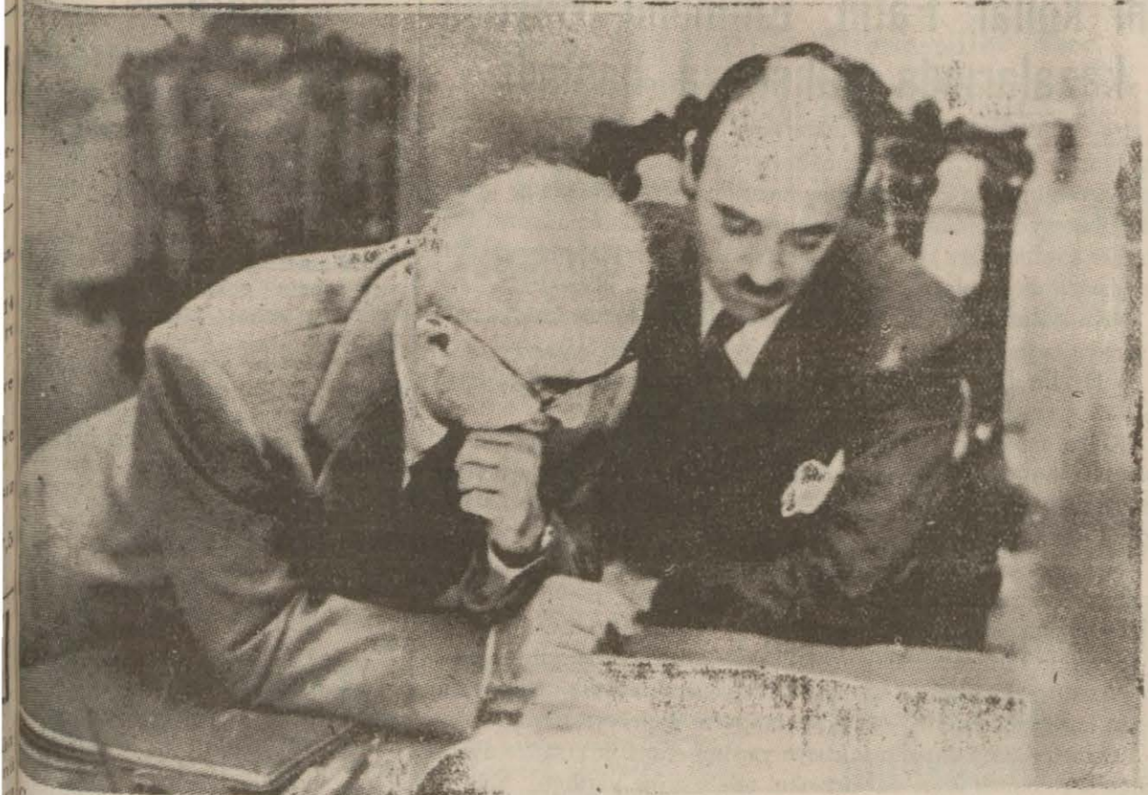
Millî Şef İsmet İnönü, evvel ki gün Ankara Halkevine şeref vermişler. Halkevi dansma ko. misyonunda bir saat meşgul ol muşlardı. Resim, bu intibai tes bi: ediyor.

Moskova, 23 (A.A.) — Gazeteler, 60 mci yıldönümü münasebetiyle Staline Hitler, Von Ribbentrop, Çankaysek, Tiso, Saracoğlu ve diğer yabancı devlet adamlarından gelen tebrik telgraflarını neşretmektedirler.