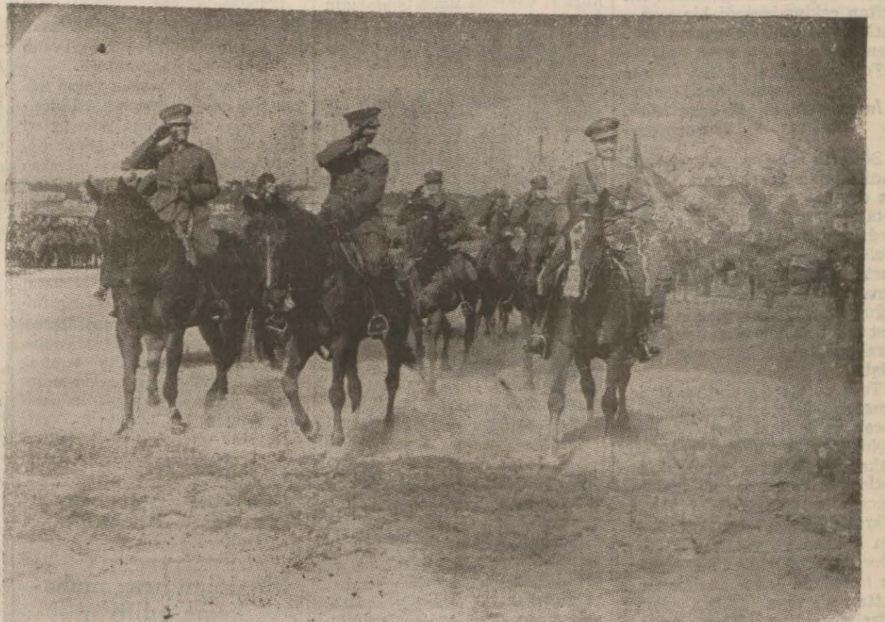
Orduya yaptığı Noel mesajında "Bu imtihanın sonuna kadar gitmeyecek olursak, içimizden hiç birinin ne ocağı, ne yurdu, ne hürriyeti, ne de şıvası kalamaz!", diyen Fin başkumandanı Mannerheim erkânıharbiyesile yaptığı bir teftiş sırasında

Ruslar, geri hatlarda havaların düzelmesini bekliyecek