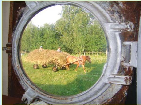
Сільські підводники.