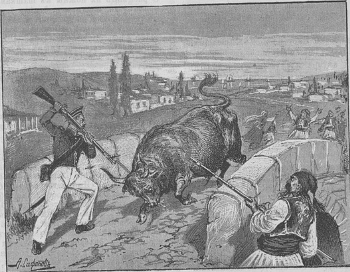
Изъ разсказа «Матрость Морозовъ».