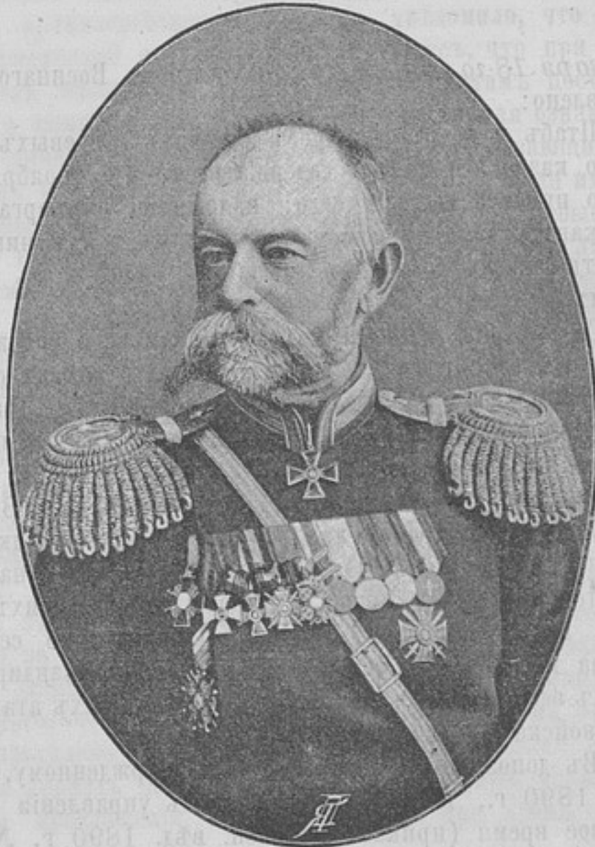
Начальникъ 2-й Закаспійской Стрѣлковой бригады, Генералъ-Маіоръ

Родился въ 1827 г. Воспитывался въ Павловскомъ кадет-