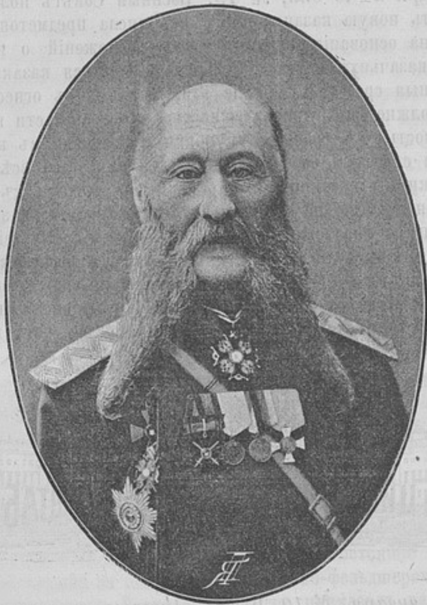
Начальникъ 33-й пѣхотной дивизіи, Генералъ-Лейтенантъ

Деньги могутъ быть высланы почтовыми марками, каждая не дороже 50 к. Безденежная подписка не принимается. За перемѣну адреса 28 к. Отдѣльные №№ высылаются за 15 к. Объявленія принимаются по особой расцѣнкѣ, высласмой по требованію.