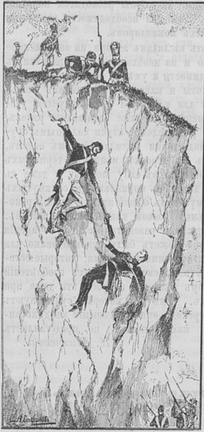
Изъ разсказа «Солдатская преданность и самопожертвованіе».

ходомъ, нѣкоторыхъ рѣжущихъ ухо словъ, какъ напр. бисуакъ , замѣнивъ его словомъ бивакъ . Само собою разумѣется, что сдѣланныя замѣчания не умаляютъ существенно достоинствъ этого новаго изданія. М. Н. К.