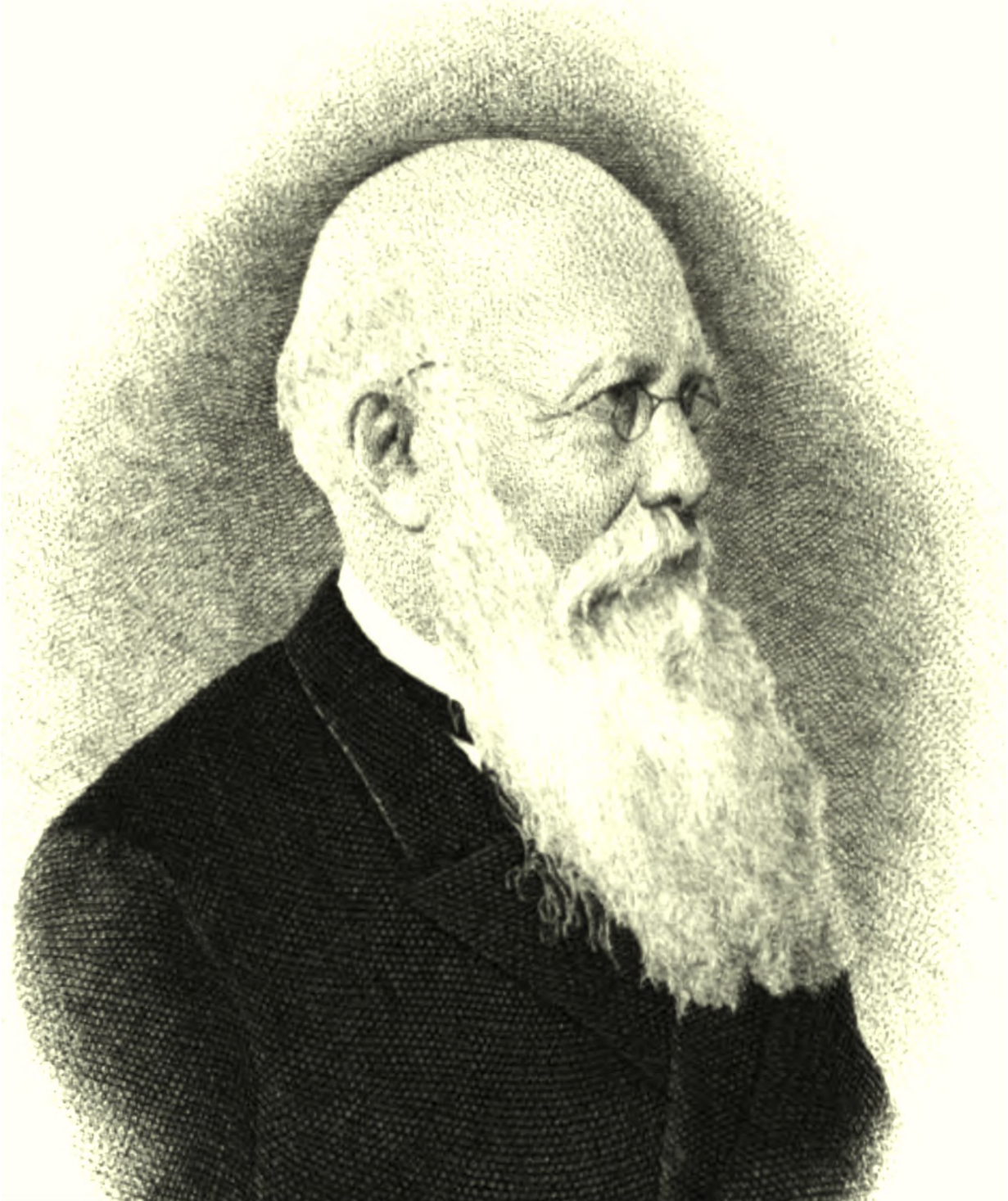
Akademik Afanasii Fedorovich Bychkov