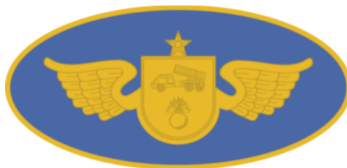
Cursos do CI Art Msl Fgt (instrutor ou monitor)