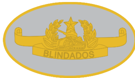
Cursos de Especialização do CI Bld (instrutor ou monitor)