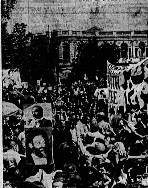
بناهای انقلاب در فرقاب خون شهدایان قدس کشید و به شکر خورشید شمس و اکون جهه تازه ای در عرصه کارزار علیه امریکای خائیکار و سایر مستکبران جهانخواز با تکیه بر اندیشه انقلابی و ضد استکباری اسلام که با خون رسولان عصیان سرشته شده، باز گردیده است. امریکای جهانخواز بداند که دست نظام الهی از آستین خلق مسلمان ایران بدر خواهد آمد و او را بر زمین باطلش را به زبانه جان تاریخ خواهد فرستاد.