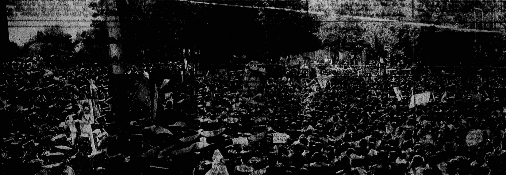
اگر حسین به همراه ۷۲ تن از یارانش از دم تیغ العاصی نفاق گذرانده شدند و اگر مطهری ها و مفتاح ها و پیشانی ها توسط دشمنان خدا و خلق ترو می شوند و انقلاب اسلامی به با خون سرخ هر شهید فصل نغزای در تاریخ بشر می کشاید و شهدای اسلام به شهادت خویش زنده و برای گسری پنهانی از این فراموشی و غلات علمی در جهان آماده تر می گردند