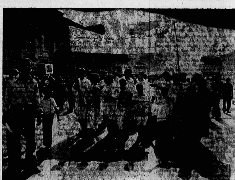
مزاران تن از مردم آگاه و ایثارگر تهران از اولین ساعات صبح امروز در لانه مرگ پر از آتش و خون در گانه مزدک جانیده شهدای روز کتیدیه گره آمدند و به هزارانی پرخشند و ساعت ها در گرمای سوزان آفتاب شمشادانه به انتظار نشستند تا برانند با آخرین نگاه ها از باران همیشه صادق امام و امت و باغ گویند