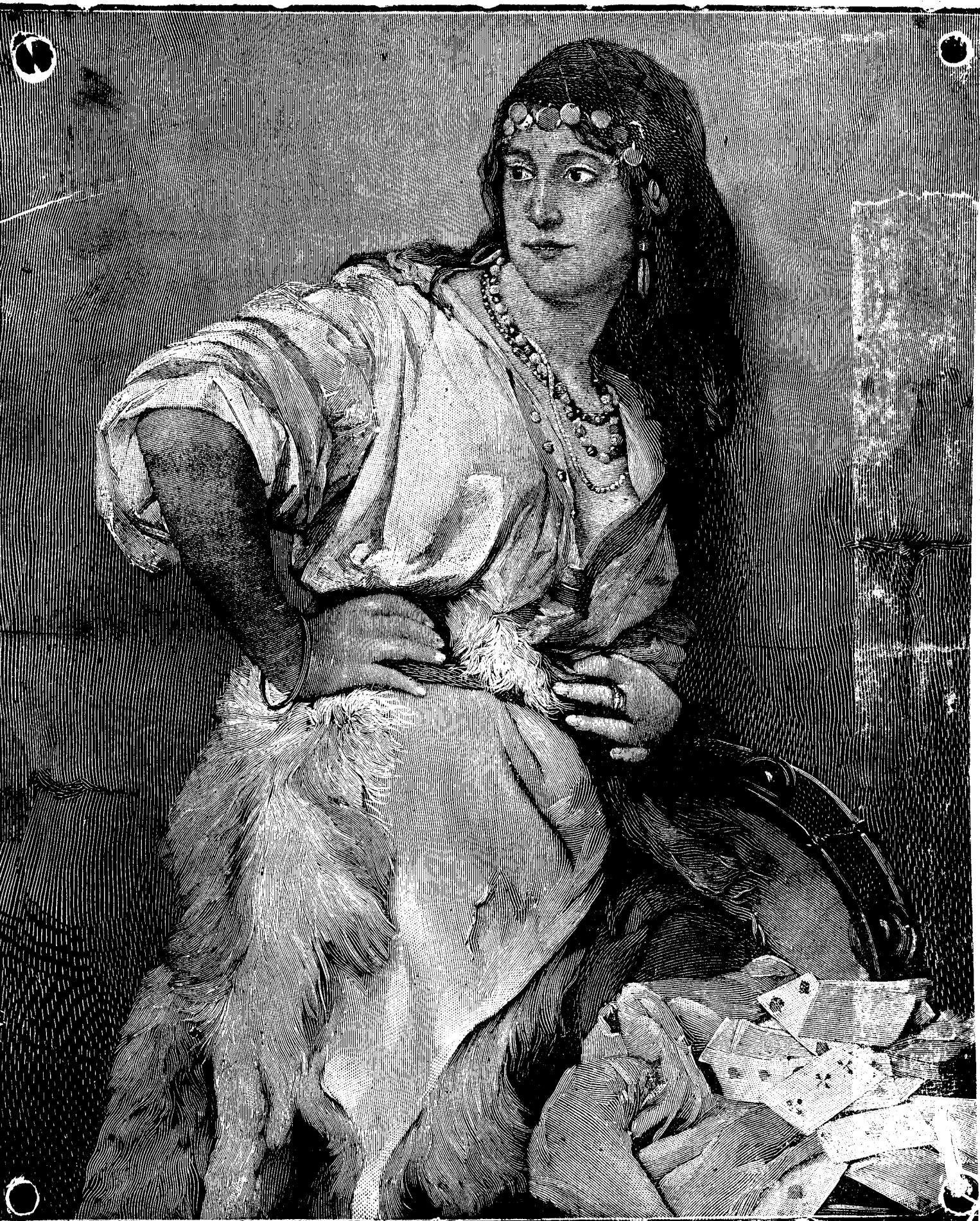
T I G A N C A V R A J I T Ó R E .