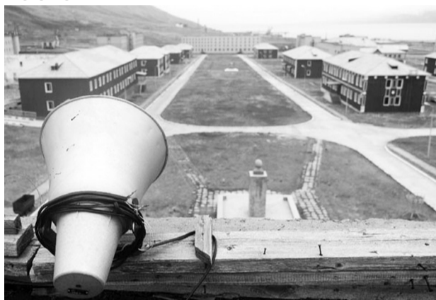
Покинута майже двадцять років тому селище Піраміда

Радянський Союз розвалився, а тогочасна Росія не мала бажання виділяти багато грошей на статусний проект. Рудник законсервували, а разом з ним й ідеальне містечко.