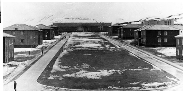
Селище Піраміда наприкінці вісімдесятих років

До послуг жителів Піраміди була лікарня, школа з дитячим садочком, величезний спортивно-культурний комплекс, якому може позаздрити більшість радянських райцентрів, критий басейн, їдальня з делікатесами на кшталт червоної та чорної ікри. Усе це – абсолютно безкоштовно.