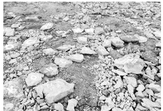
Пам'ятка про шахтарів вісімдесятих років на вершині гори Піраміда

За кілька десятиліть ці написи ніскільки не вицвіли, навіть каміння з буквами «К», «О», «Н», «С», «Т», «А», «Н», «Т», «И», «Н», «О», «В», «К», «А» лежать у суворій послідовності, як їх залишив шахтар на прізвище «М», «О», «С», «К», «В», «И», «Н» колись за часів Радянського Союзу.