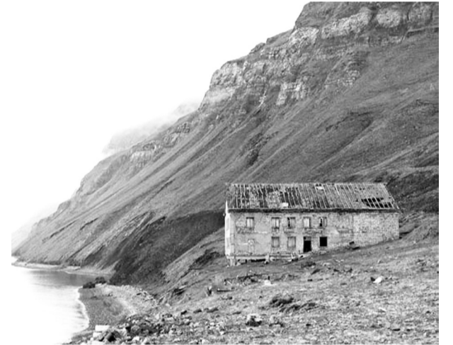
Руїни радянського селища Грумант

Радянські поселення на Шпіцбергені можна назвати одним з небагатьох місць на Землі, де дійсно був побудований комунізм.