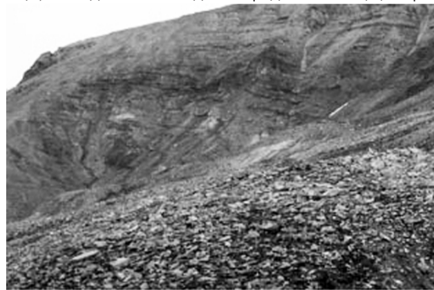
Гора Піраміда, яка дала назву шахті та селищу

У ньому мешкає 450 чоловік. «80-85 відсотків – українці», – повідомляє нам гід. Як і в радянські часи, це пере-