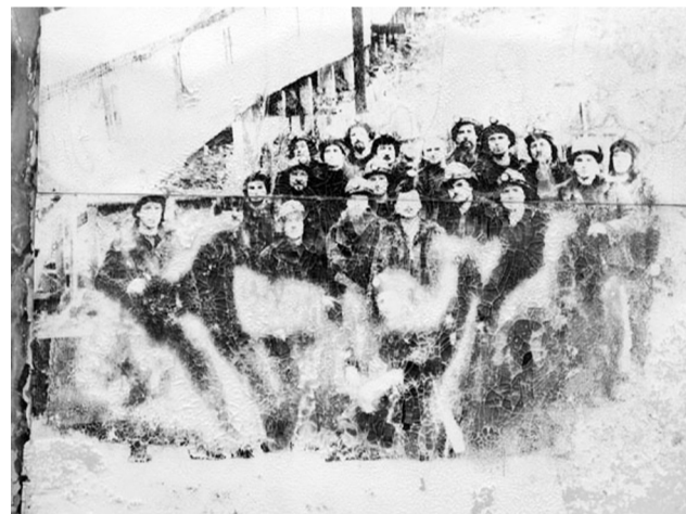
Стара фотографія шахтарів на дошці пошани у Піраміді

«Арктикуголь» поважає українське громадянство своїх працівників. Наприклад, донедавна в місцевій школі навіть викладали українську мову та літературу (зазвичай, цим займаються дружини шахтарів, які переїхали разом з чоловіками в Арктику).