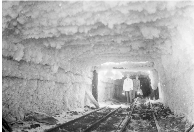
Замерзла шахта на Шпіцбергені

Радянський Союз підписав цей трактат і повернувся на Шпіцберген у 1935 році. Хоча вже у 1931-у він викупив приватну американську компанію «Англо-Русский Грумант» (Грумант – ще одна історична назва архіпелагу, поморська) та створив на її базі трест «Арктикуголь», який існує і в наші дні.