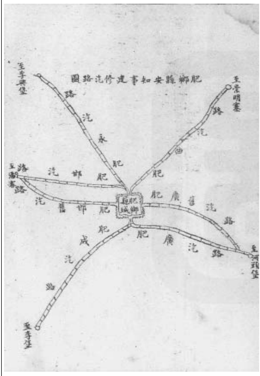
肥鄉縣安知事修建肥廣肥邯肥永肥曲汽路表