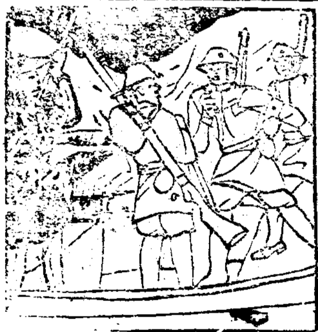
鬼子兵過船檢查，阿大假意待他們很客氣。

西醫必須經過學校與醫院的訓練，前者重理論，後者重實驗。名稱可分醫師、藥劑師、護士；類別可分內科、外科、產科，各有專門之修養。雖也有單從醫院裏見習成獻的，學術上必有所缺，至多充一個助理醫師足矣。中醫雖目前也有專設的學校，但畢竟還是個人傳授的來得多。舊法學醫，其程序是拜師，讀湯頭歌，藥性賦、傷寒論，註難經等重要醫書，然後見習、陪診，俟有相當的把握，使得滿師，便請登記執業。各郡祀奉張仲景（東漢時長沙太守，著傷寒論）扁鵲（姓秦名越，秦之盧國人，作八十一難經解）為醫祖。近代名醫如上海張聿彭，拖小辮子，坐小官橋，一望就知是唯一的傷寒名醫，據資甚鉅。丁仲仁以和平精密見長，所以，成為穩健派的領袖，門人極多。此外如甯波范文虎，獨樹一幟，以經驗的胆魄用藥，也有特著的地位，其最大的區別，就是喜用不平常的藥。且藥的分量極重。藥的味數極少。惜上面所介紹的三位，均已沒有在世了，似覺中醫中失了三顆巨星。記得又有一個無名的孺醫方上池先生，年輕而博學廣，潛居精研，不喜溜到外面來求取虛偽的名聲，所以，知者甚少。某年，作者有一位親戚，因感冒失治，釀成氣陷便塞，