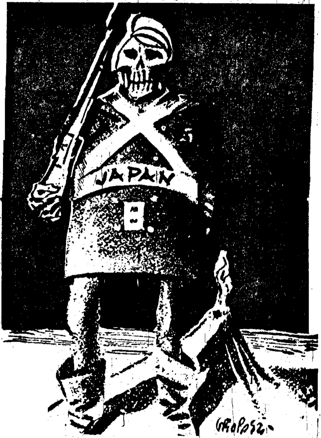
日本軍閥的眞面目

九月的展望 郭安·編者 八月的感想 有秋·田茵·田堅·如書 戰爭途上的世界 真·盧秋·許智遠·盧萍 遠東前哨的馬來亞 塞克辛·傑克·辛·陳南彬 百科文庫散篇 謝·金丁·沈·芳聲·丹里·如書 小說戲劇詩歌及其他 光瀛·王紹清·劉思·雲林·堅·碧潔 60