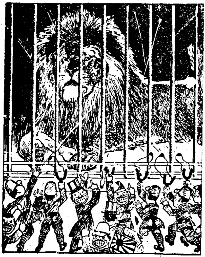
！耐忍要需然當這，籠入子獅

偉烈的光芒，必然的將洗刷了九月的血腥與恥辱的污點！ 這將是什麼呢？首先是中國必然強大起來！中國必然會戰勝過敵人的！敵人已經掘好了的墳墓，我們已能更快的推牠進墳墓。敵人正在作最後的掙扎，我們已能對他作最猛烈的最後的打擊！正如蔣委員長所指示：「洋厲番發作殊死戰，完成捍衛國家，驅逐暴敵，復興民族的大業」，同時，中國有着極光榮的歷史的，廿八年十月辛亥革命的經驗與教訓，正好給我們以記取，今日我們唯一的將加強國共合作，加強抗日民族統一戰線，來爭取抗戰的勝利，來完成辛亥革命未完成的偉大事業。 其次，在東方雖然國際安協讓步主義者，引誘中國投降，他們的陰險政策是縱容東方強盜的侵略中國，策動太平洋會議，但是這些是扮演不得的，因為中國是必然會切實堅持抗戰，全民族的更加團結，全民團結的中心基礎是國共及各黨派的團結，這些足以聚散敵人的切陰謀。 第三，當前歐局的危急，波蘭前此雖不承受蘇聯紅軍進入保障之提議，但在希特拉猛攻下，亦唯有站起來以打擊子打擊者了！英法向德提出的哀的美敦書，應再不是去年九月所謂總動員做勢的舊作風吧，希特拉的大欲絕不只是但澤和波蘭走廊的。柏林方面不是已公開的這樣傳出：在但澤與波蘭走廊之後，還有這樣的五個大綱，在直接迫着英法嗎？一，英法聲明在中歐及東南歐擁護其一切特殊權利，二，西班牙收回直布羅陀，三，收回殖民地，四，改變集波提及突尼斯現狀，五，改組蘇聯土運河的行政機構。 不錯，安協讓步主義者，是愿意付出相當「代價」的。但騙局終是欲被拆破的，歷史到底不准再被拉回到去年九月慕尼黑會議的時代去的！ 塞絕安協的暗流，洗刷血腥與恥辱，正期待我們和平人類來負責！——這特別落落在年青者的一代！九月第一週的國際青年節的降臨，正是這一指示的具體說明，特別是生活在馬來亞青年們，尤其要發揮先鋒的作用，擊退侵略者，來爭取和平，自由，幸福！