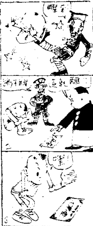
開眼財見此如大 一作湧石一

在這，到是，直克 麼裏件的的館地繪 是，的一也給覺覺 叫，容欣繪裏位畫 境件就它在齊據着我易賞畫，。佔在 界事是所心說近一們的，。都世這中 ；創吸中；代欣得事却但陳界一國 格是因造引猛美大賞先。很是列各個藝 和為，住然感美一說說不中有大重術 論經自每欣，見只學。明到是國中博要中 的驗己人賞這到是家 什這一畫國物的， 生我美的所所與就一 們學反創能創是個 映造領造欣意 的略只賞象