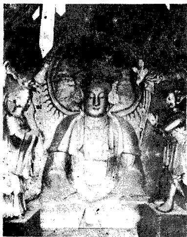
石 觀 音 像

周處讀書處台：相傳晉之周處，爲陽羨惡霸，鄉里畏之，一日晤老農，告以南山猛虎，長橋蛟龍與處，爲地方三大害。處由是幡然悔悟，乃刺虎斬蛟而自新，時年已三十，乃從業帥時入陸磯陸云，後征討平西，封孝侯。千古傳爲美談。台在石觀音之左，進門，有怪石矜松，此是宜興同鄉會產，（宜興卽故之陽羨）今有小學在焉。享堂在高