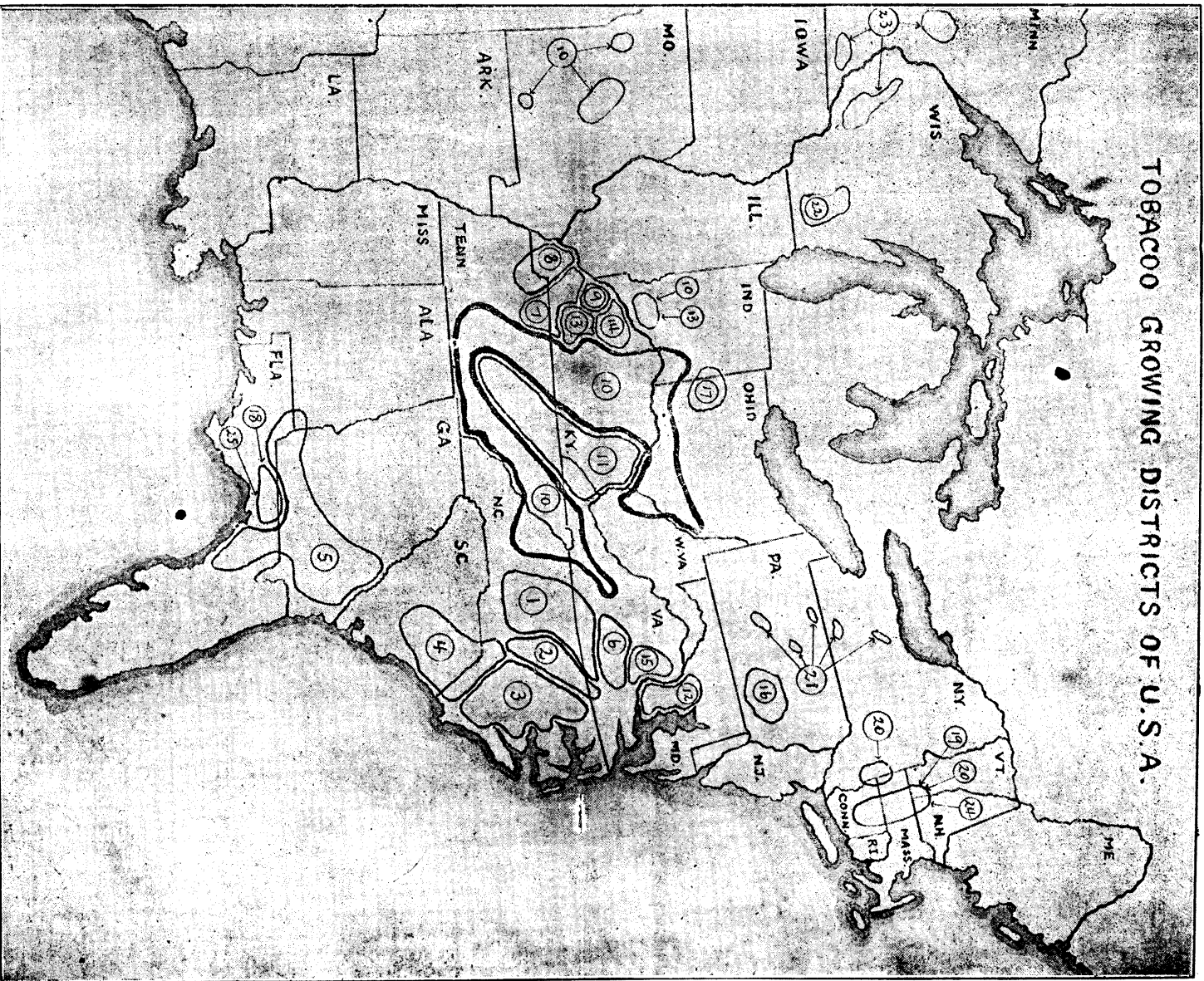
(此圖表明美國產菸區域，至于各區所產菸葉名稱，則詳載次頁)