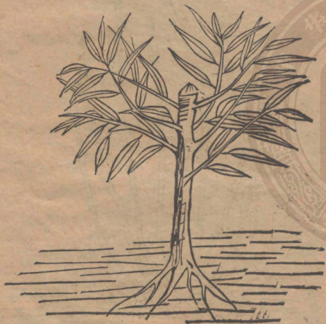
圖 椿 栽 柳 蒿