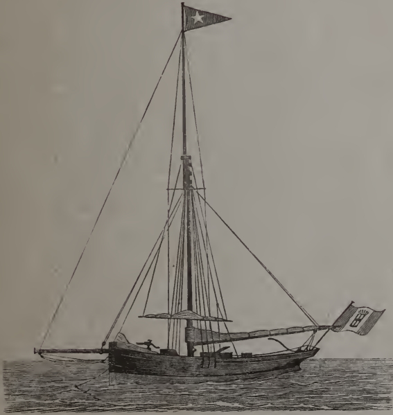
Cutter Violante .