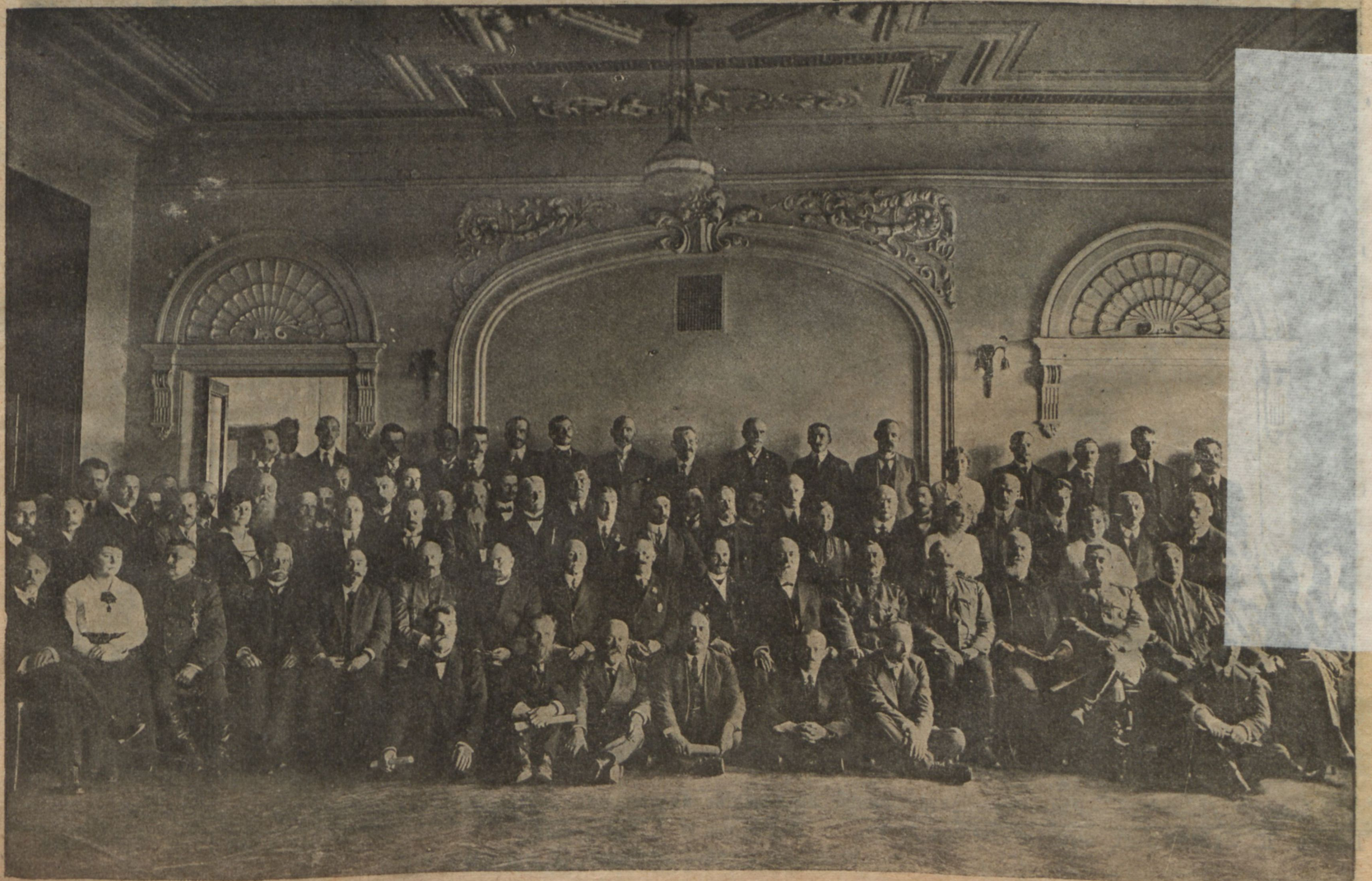
Участники состоявшагося на-дняхъ въ Кіевѣ 3-го областного совѣщанія по вопросамъ машиноторговли и общественнаго машинопользованія.