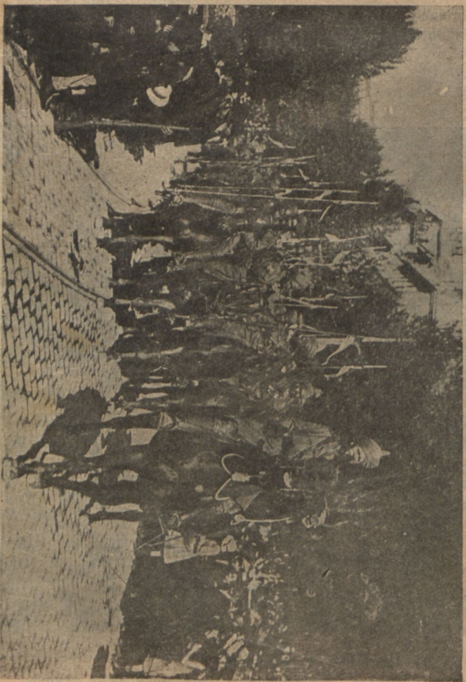
Индусская кавалерія, прибывшая въ Марсель.