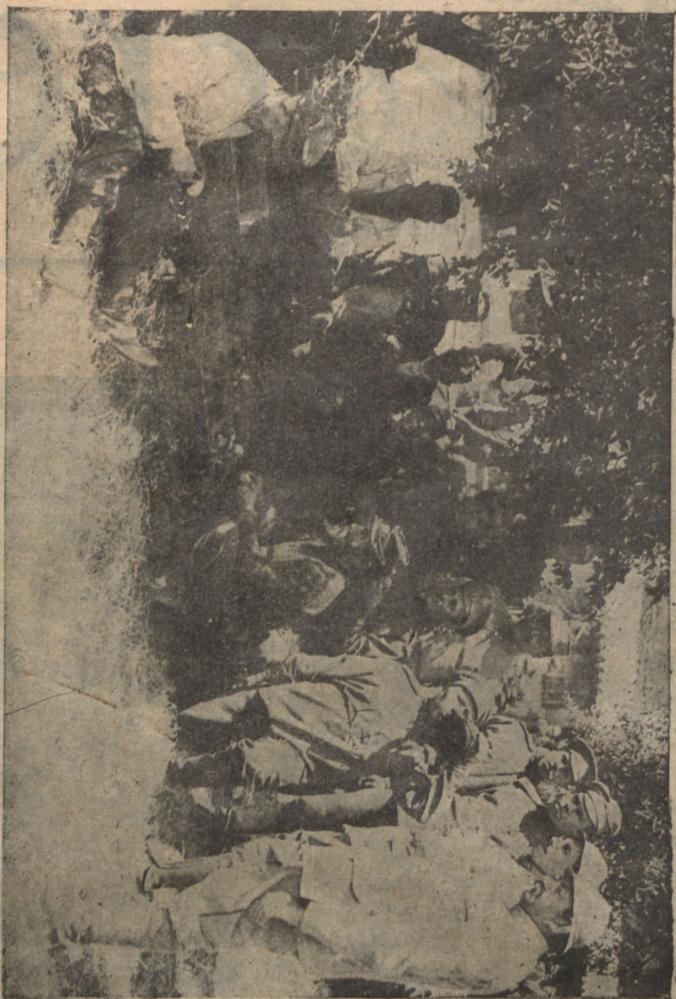
Русскія войска у Марселя. Чистка картофеля для обѣда.