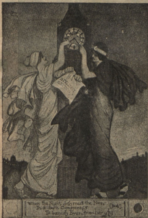
Переводъ времени впередъ. Англійскіе рисунки по поводу перевода времени на одинъ часъ впередъ.