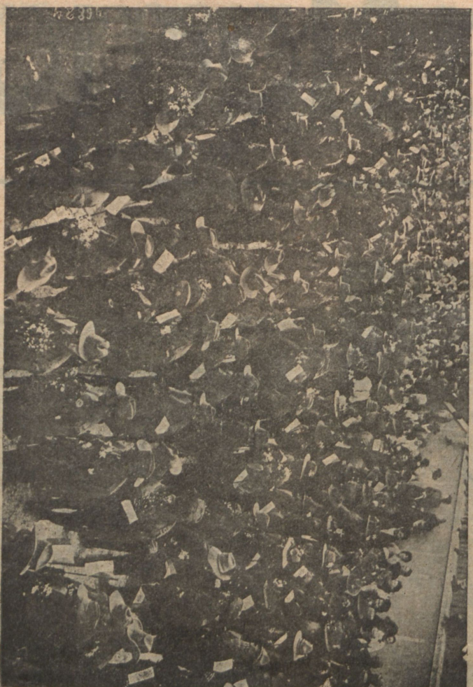
Австралийскія войска, прибывшія въ Марсель.