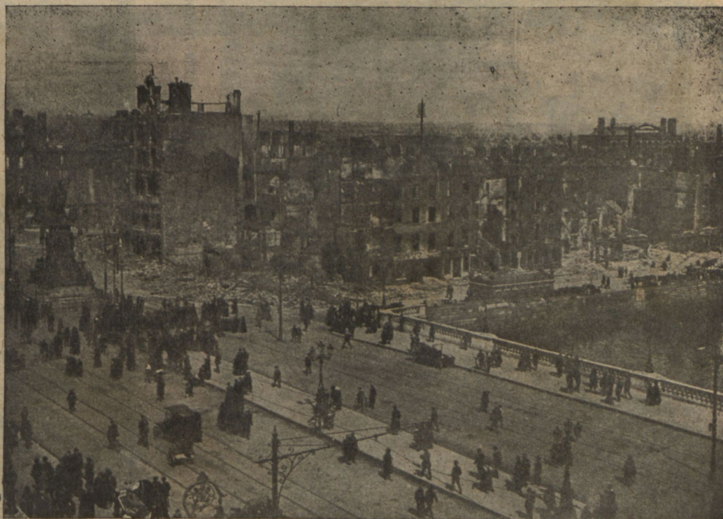
Къ возстанію въ Ирландіи. Центральная часть Дублина, разрушенная артиллерійскимъ огнемъ.