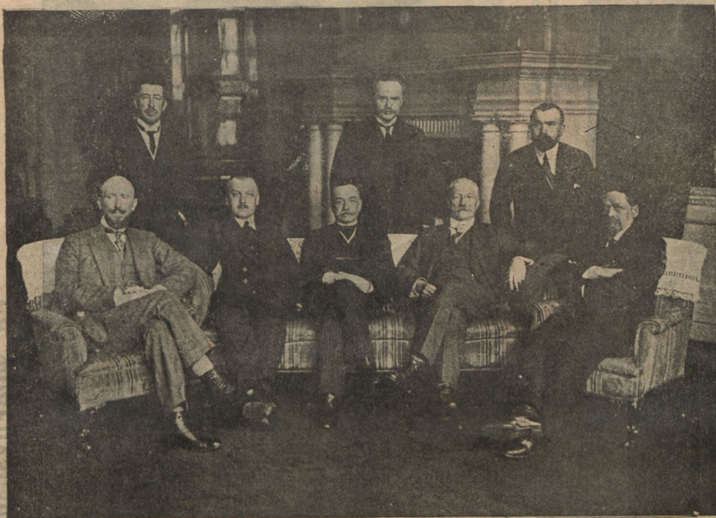
Русская парламентская делегация въ Лондонѣ.