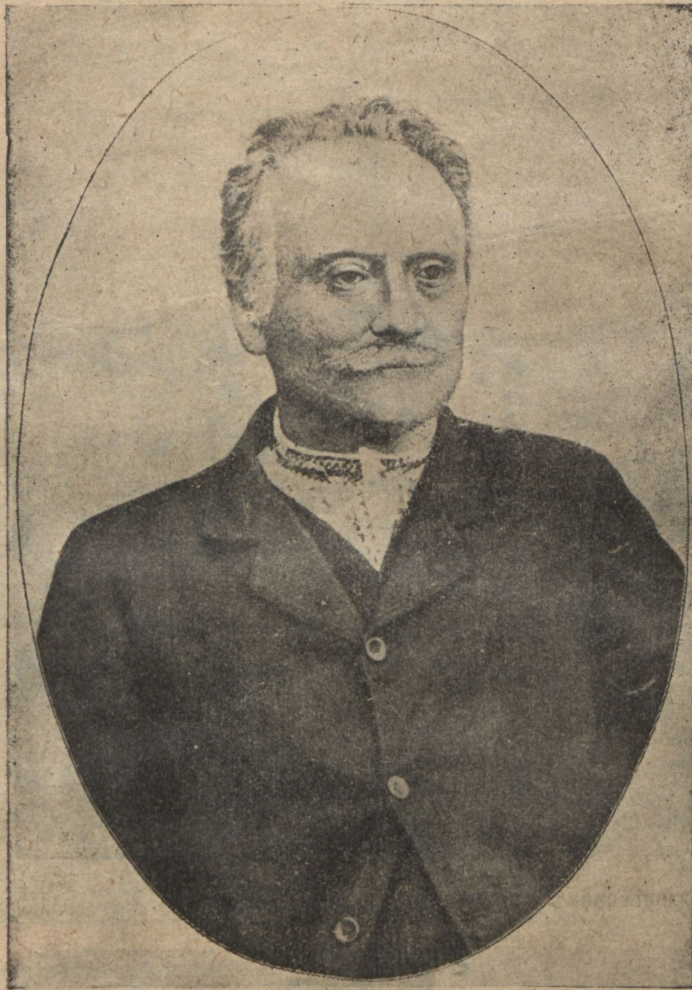
Иванъ Франко, известный украинскій писатель и политическій дѣятель, на-дняхъ скончавшійся во Львовѣ. (Одинъ изъ послѣднихъ пор третовъ).