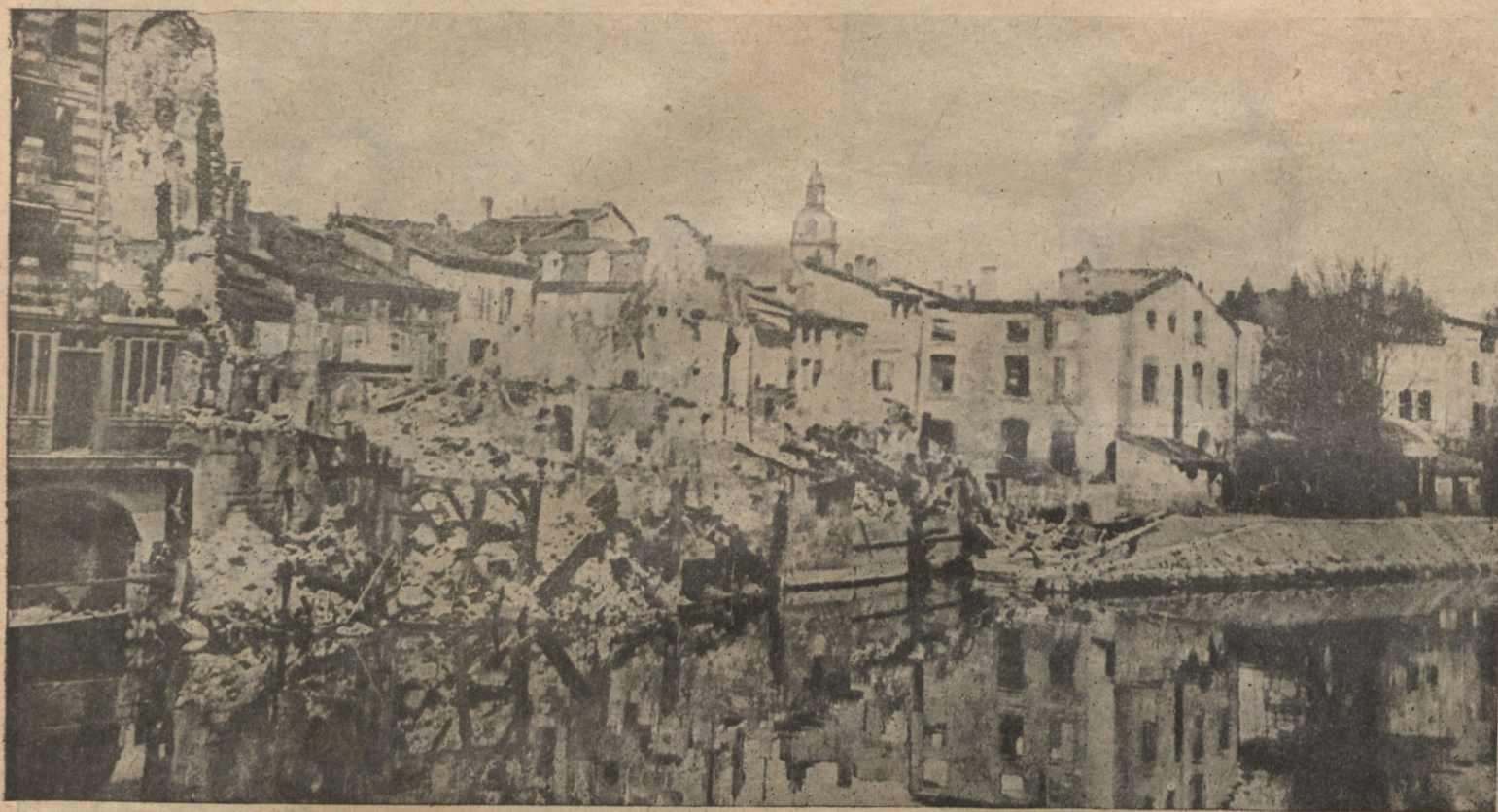
Часть Вердена, разрушенная артиллерійскимъ огнемъ.