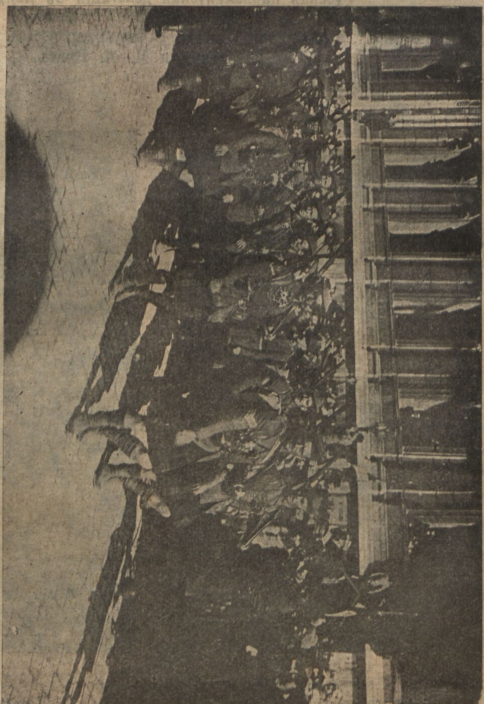
Британскія колониальныя войска. Шестые южно-африканскіе горцевъ по ущельямъ Марселя.