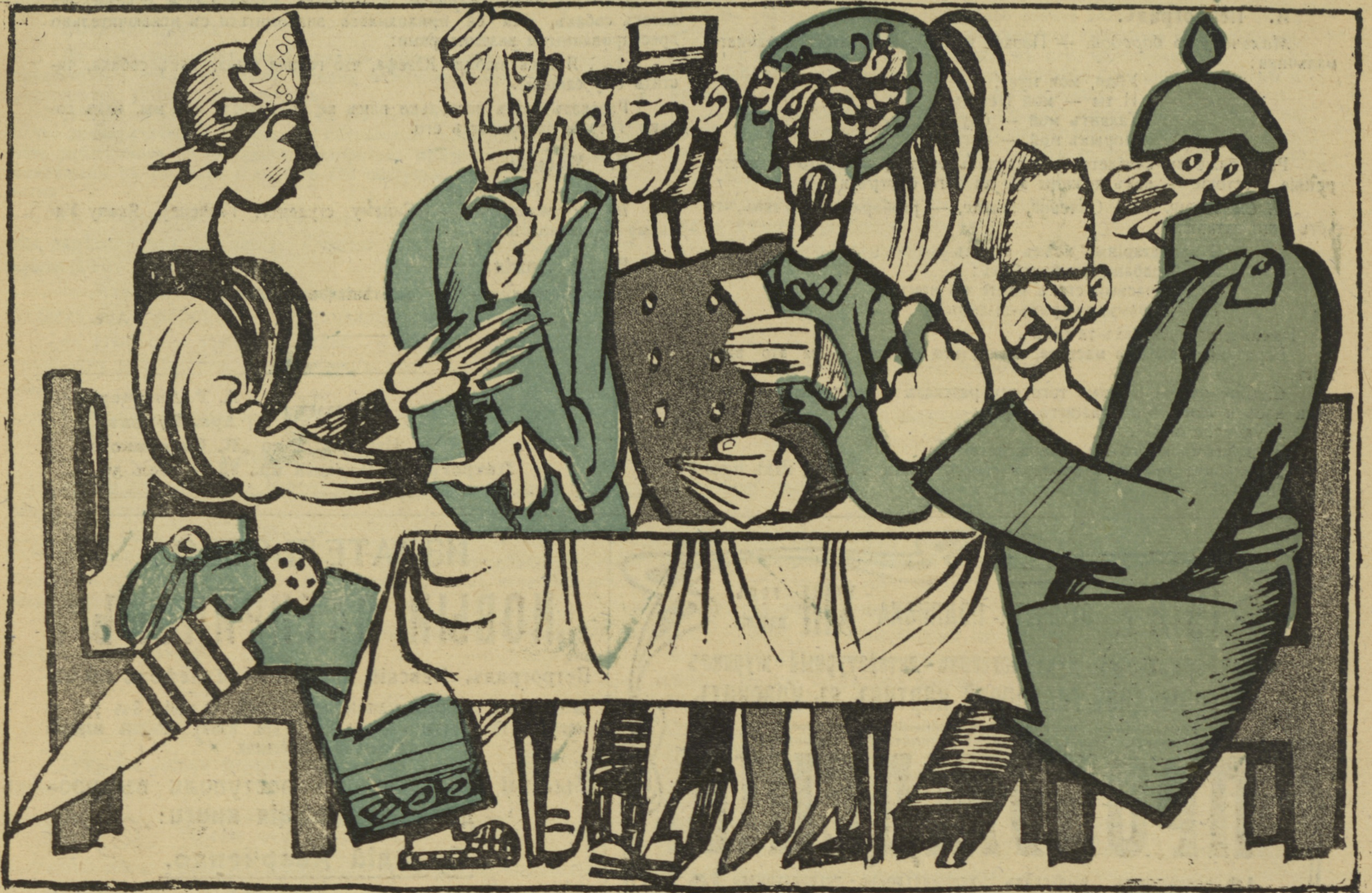
Рис. А. Радакова.