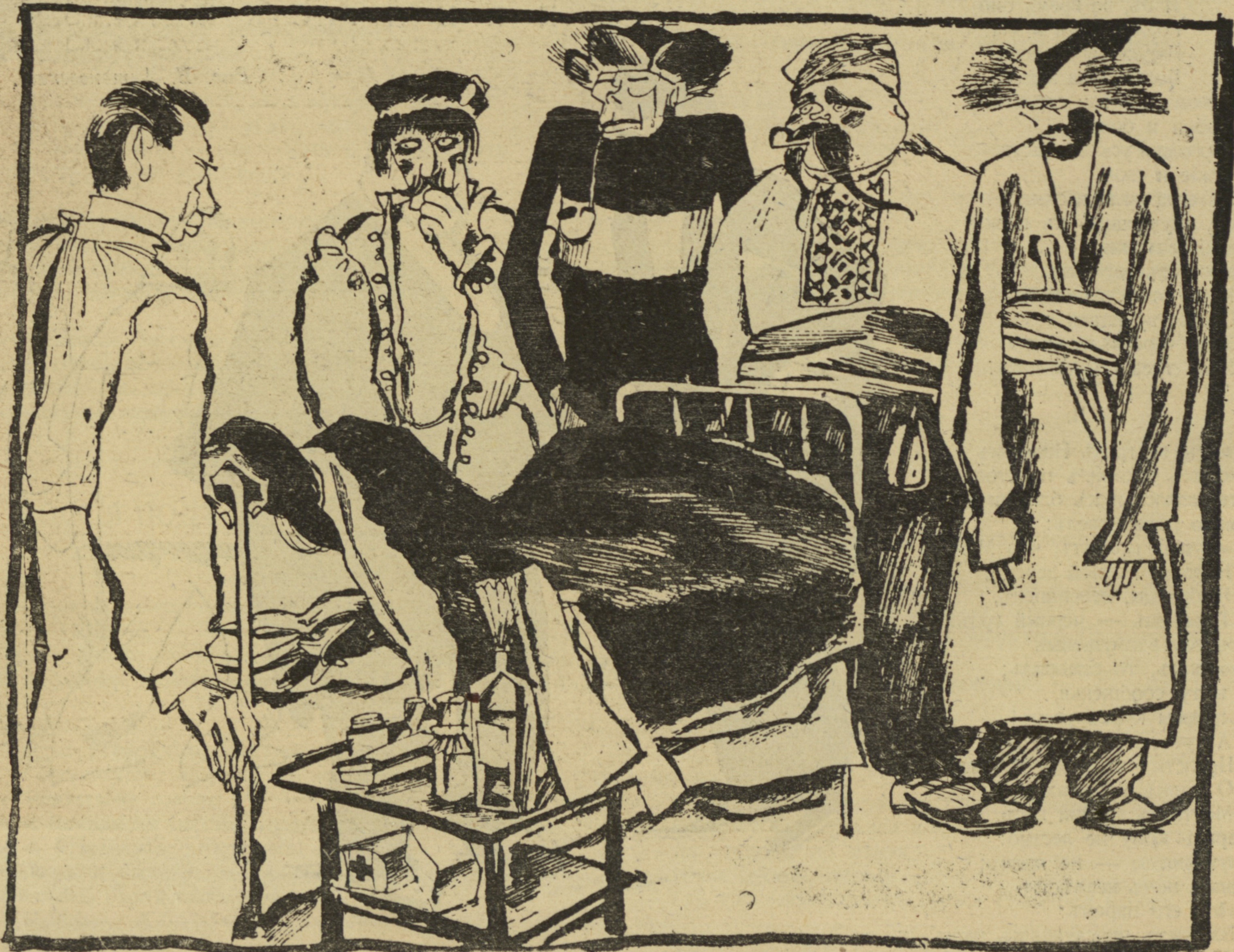
Рис. В. Лебедева.

Сепаратисты (у одрабольной Россіи): — Ну, какъ Россія? Выживетъ?