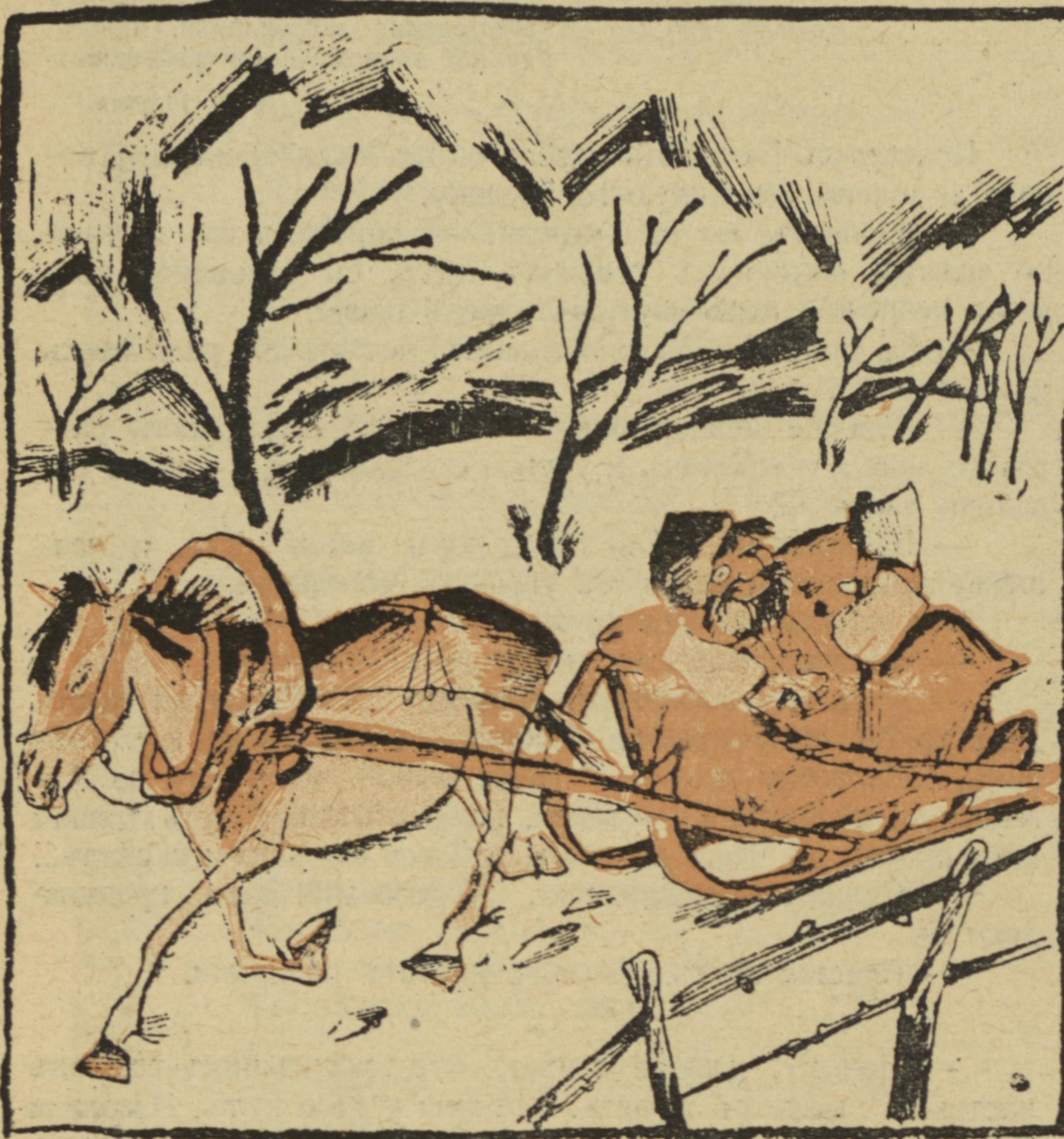
Рис. В. Лебедева.

Зима, крестьянинъ торжествуя, На дровняхъ обновляетъ путь, Его лошадка, аграрный погромъ почуя, Несется рысью, а не какъ-нибудь.