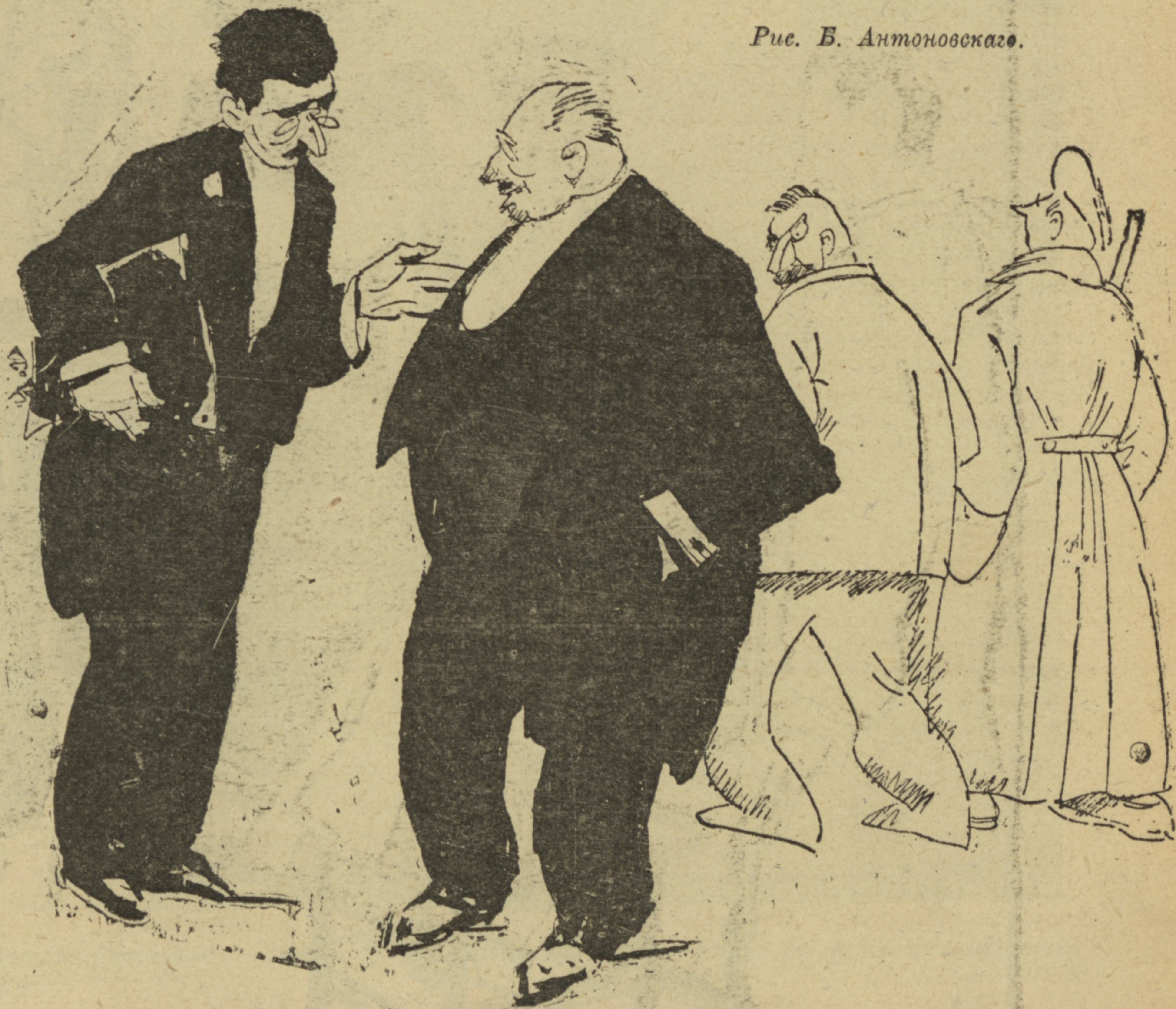
Рис. В. Антоновскаго.

Адвокатъ: — А съ моимъ кліентомъ прямо по-царски поступили. — Оправдали? — Я же говорю — по-царски. Въ Тобольскъ на поселеніе сослали.