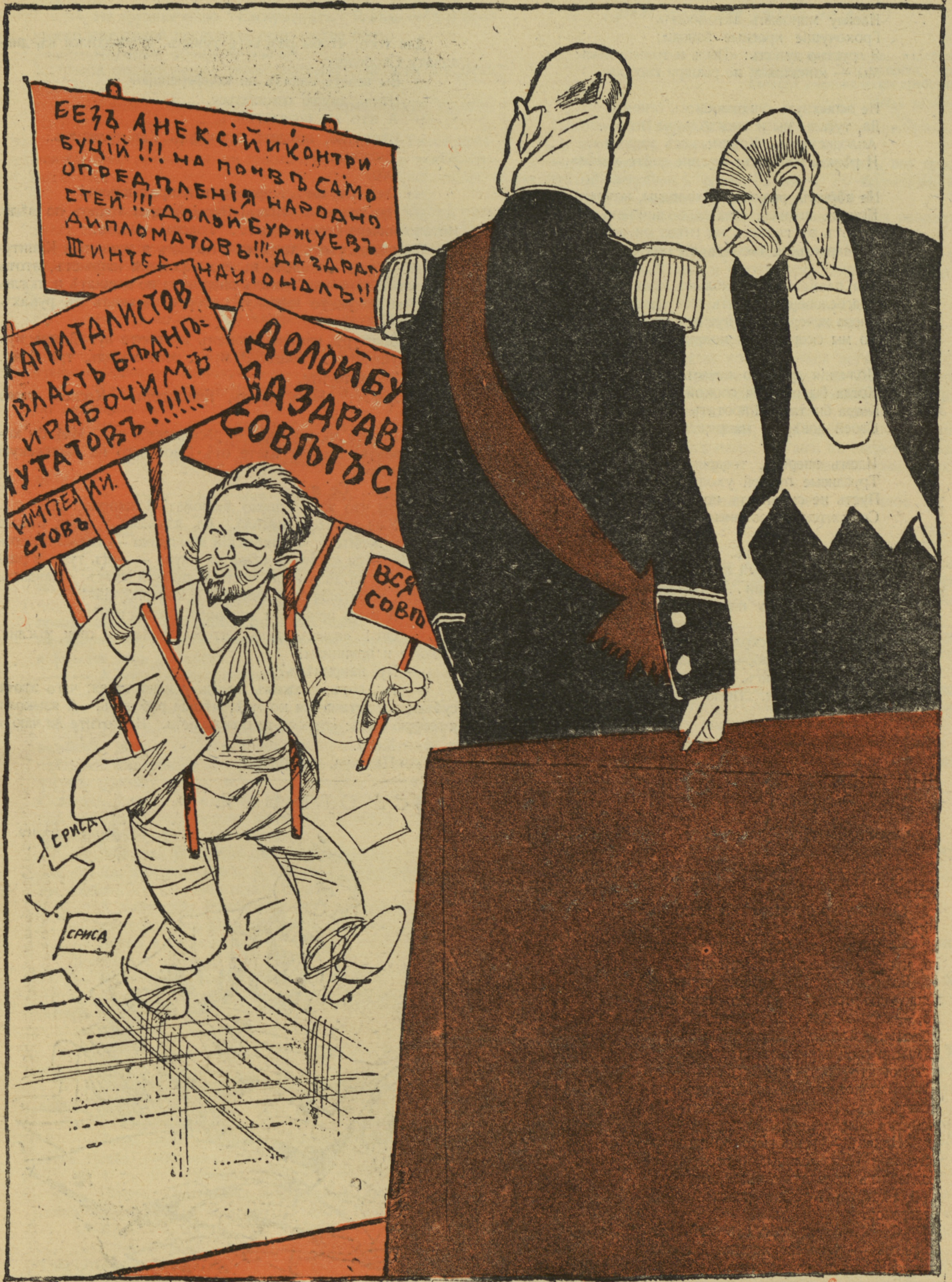
Иностр. дипломатъ (осмотрѣвъ Скобелева): — Нужно будетъ сказать этому молодому человѣку, чтобы онъ весь этотъ свой багажъ въ прихожей оставилъ...