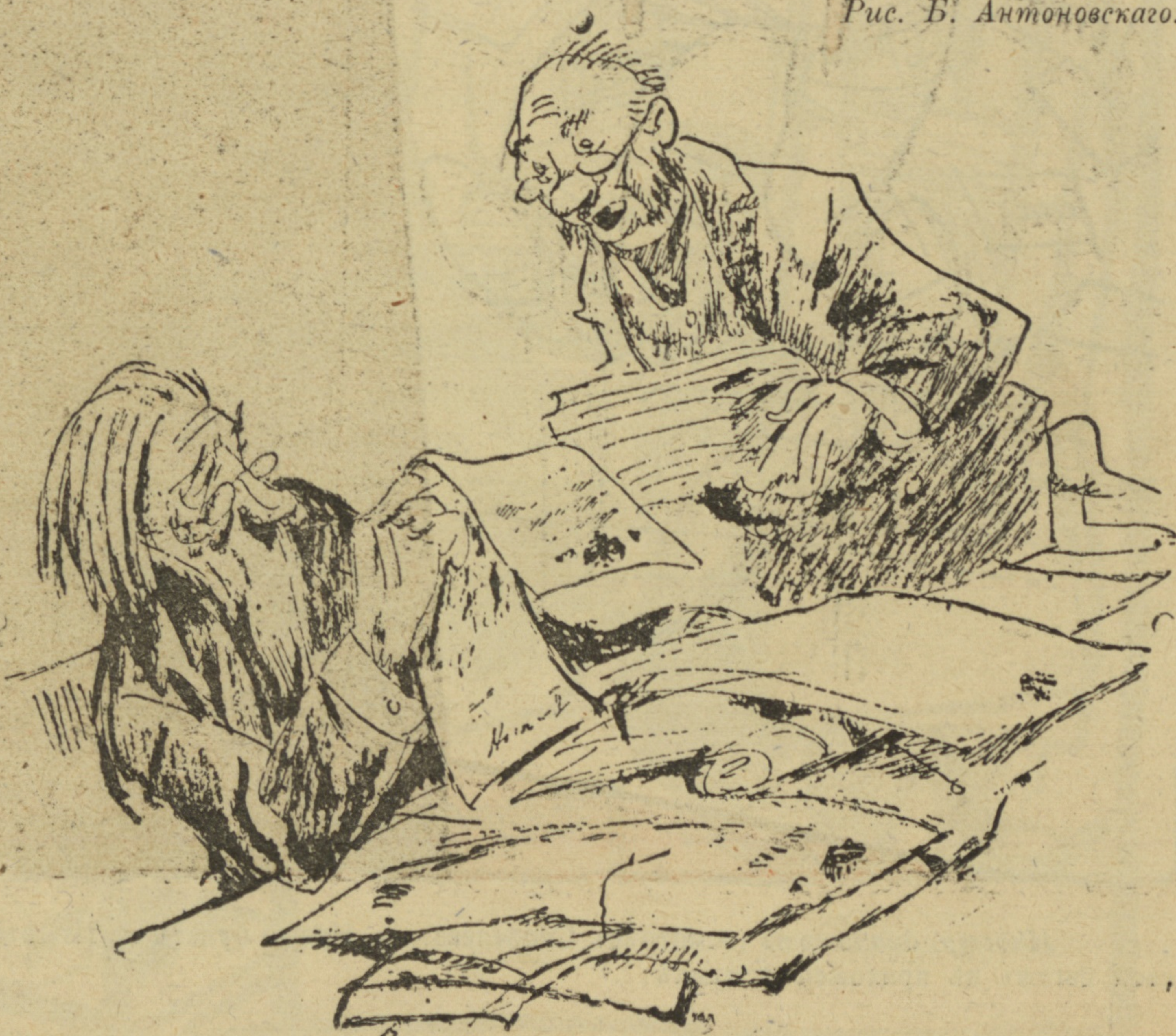
Рис. Б. Антоновскаго.

— Вотъ оно братство-то, Степанъ Егорычъ. Раньше писали: «имъ пове- лѣваю, а теперь пишутъ: хамъ повелѣваетъ...»