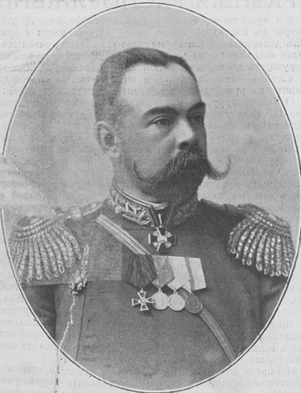
Начальникъ 64-й пѣх. резервной бригады, генералъ-маіоръ

Для подписчиковъ „Развѣдчика“ цѣна: 75 к. безъ перес. и 1 р. съ пересылк., въ какомъ угодно колич. экзempl.