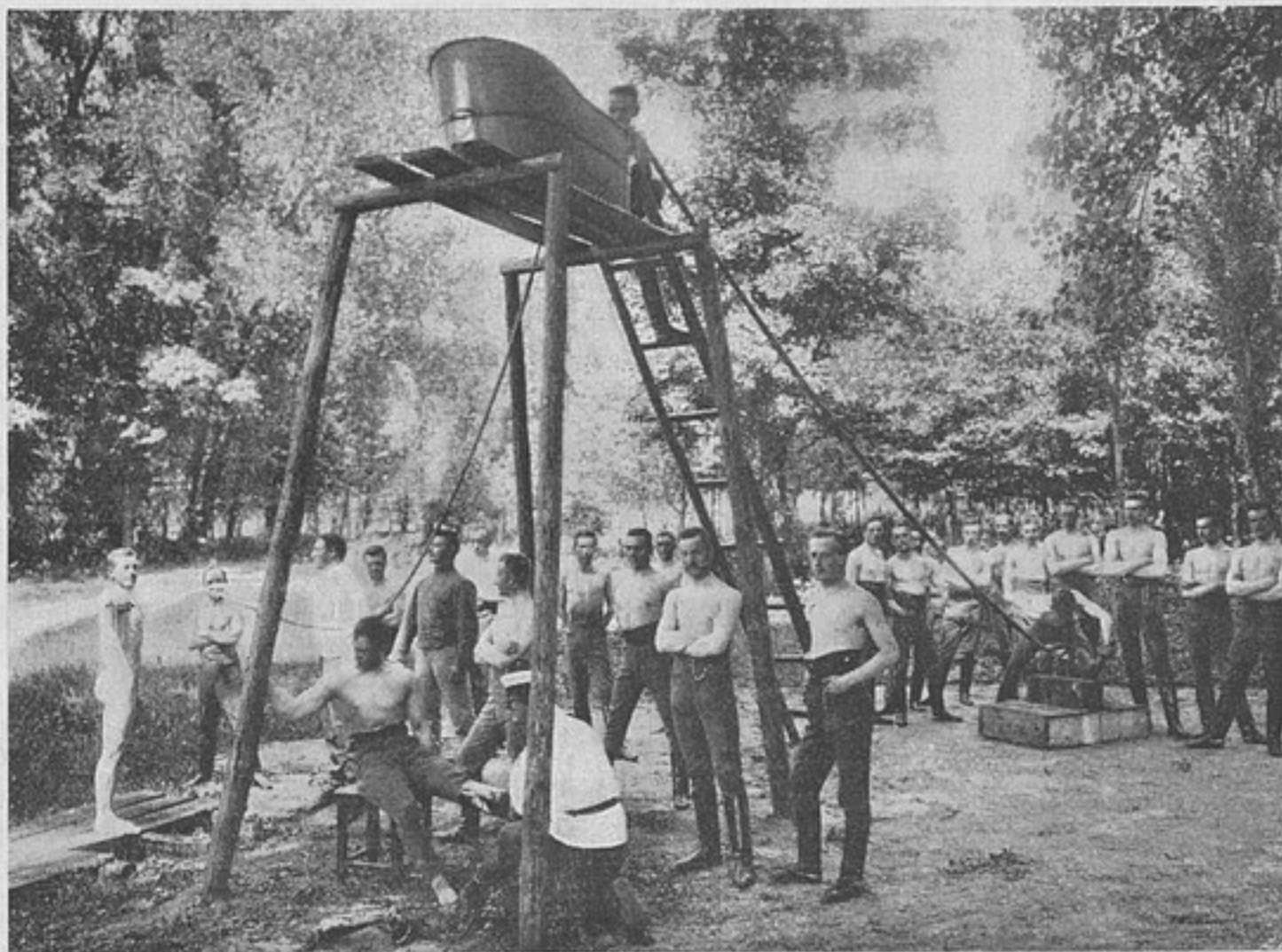
Обливаніе водой (къ ст. «Фехтованіе»).

Армія обильно снабжена всевозможными техническими учрежденіями вспомогательнаго характера, не уступая во всѣхъ отношеніяхъ европейскимъ учрежденіямъ подобнаго рода.