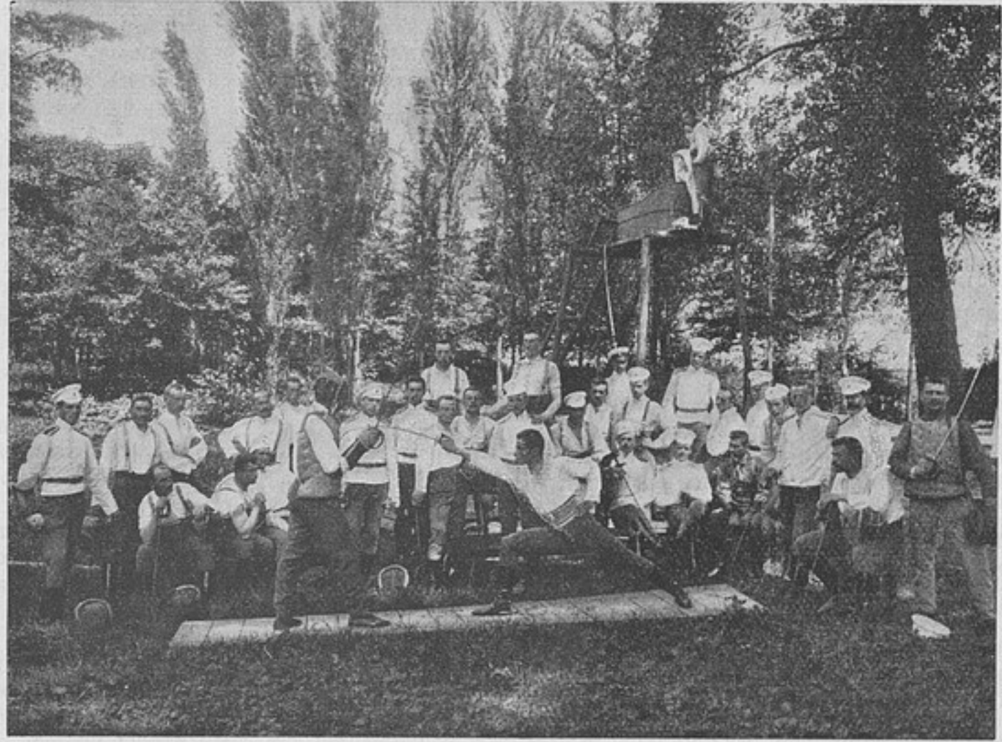
Фехтованіе юнкеровъ Елисаветградскаго училища.

Намѣренія Россіи покрыты непроницаемой тайной. Одно не подлежитъ сомнѣнію и очевидно для всѣхъ, что силы Россіи на Дальнемъ Востоку теперь уже значительны и что силы эти постоянно растутъ и увеличиваются. Въ послѣдніе годы