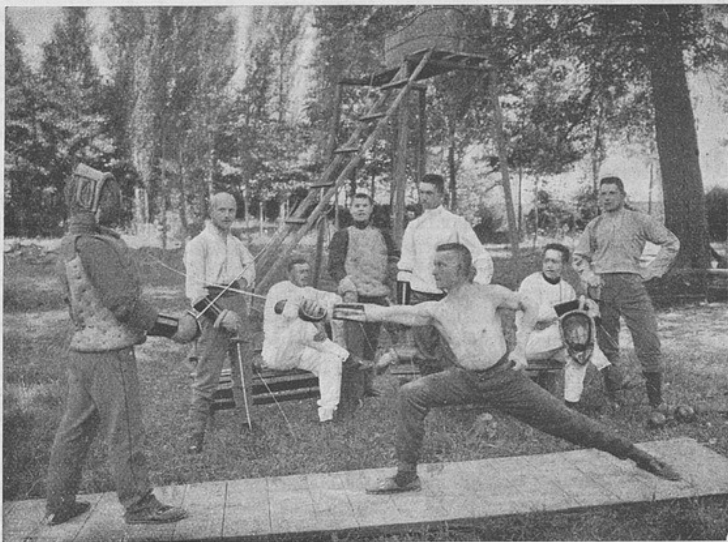
Фехтованіе юнкеровъ Елисаветградскаго училища.

избытокъ давно чувствуется; японцы надѣялись даже взять подъ свою опеку Поднебесную имперію. Но попереку всѣхъ этихъ надеждъ стала Россія, занявъ какъ разъ тѣ территоріи, на которыя готовилась наложить руку Японія. Весьма естественно, что обстоятельство это вызвало въ странѣ воинственное теченіе, выразившееся въ концѣ нынѣшняго лѣта особымъ адресомъ, поданнымъ императору корпораціей про-