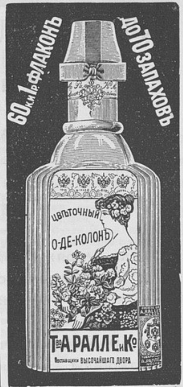
(30) — 6