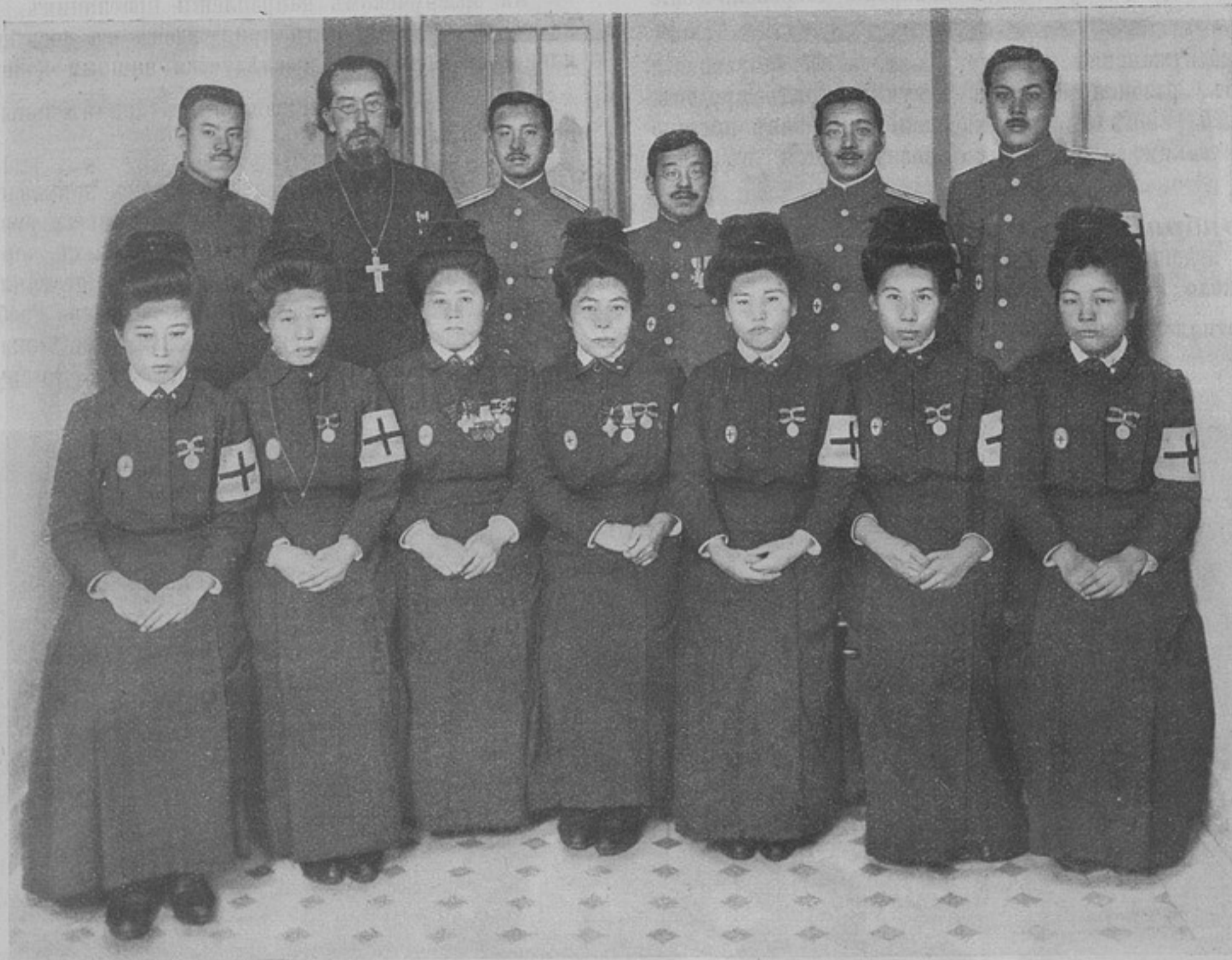
Японскій отрядъ Краснаго Креста на театрѣ военныхъ дѣйствій.