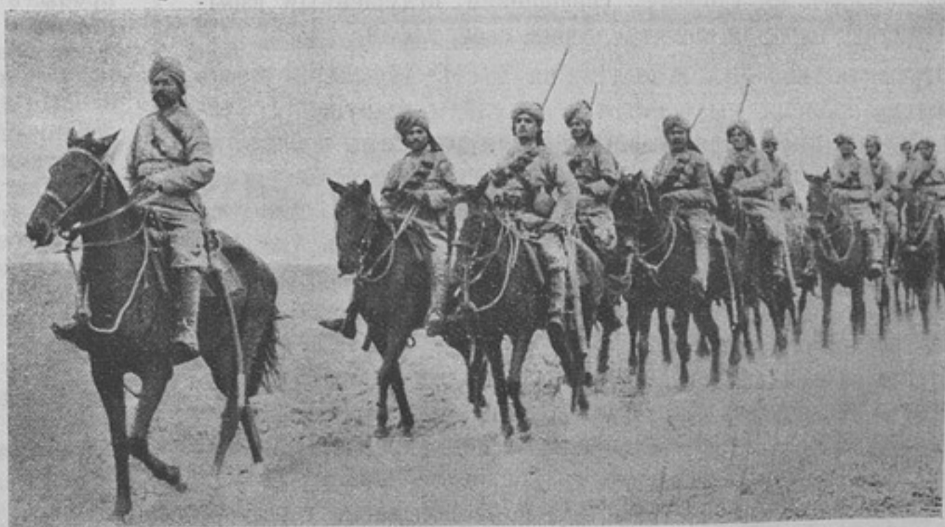
Съ театра военныхъ дѣйствій. Индійскіе уланы.

— Когда австрійцевъ выбивали изъ Равы, тутъ около самаго монастыря недалеко ихъ позиція была. Мы ихъ потѣснили, а въ это время меня и другихъ ранили. Добрались мы до монастыря, насъ въ здѣшній госпиталь и положили, монахини перевязки дѣлали, а потомъ пици было