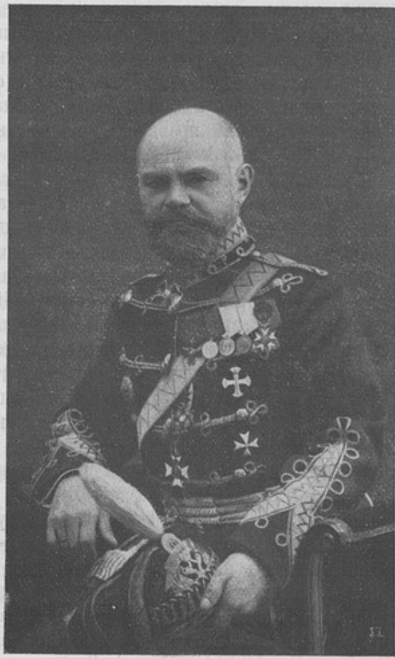
Генераль-маіоръ Абрамъ Михайловичъ ДРАГОМИРОВЪ, награжденный орденомъ св. Георгія 4-й степени.

За подвиги мужества и храбрости, оказанные княземъ Эристовымъ во время Японской кампаніи, онъ имѣетъ 6 бое- выхъ орденовъ.