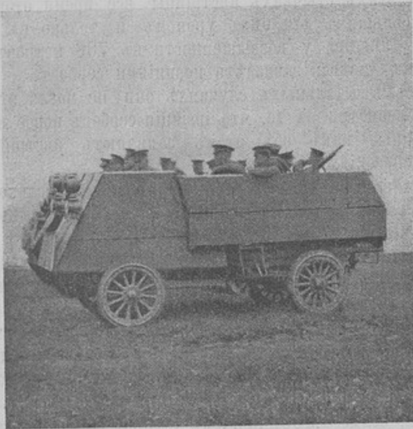
Съ театра военных дѣйствій. Канадскій блиндированный автомобиль.

того сербская артиллерія заставила замолчать непріятельскую артиллерію, пытавшуюся поддержать мониторы.