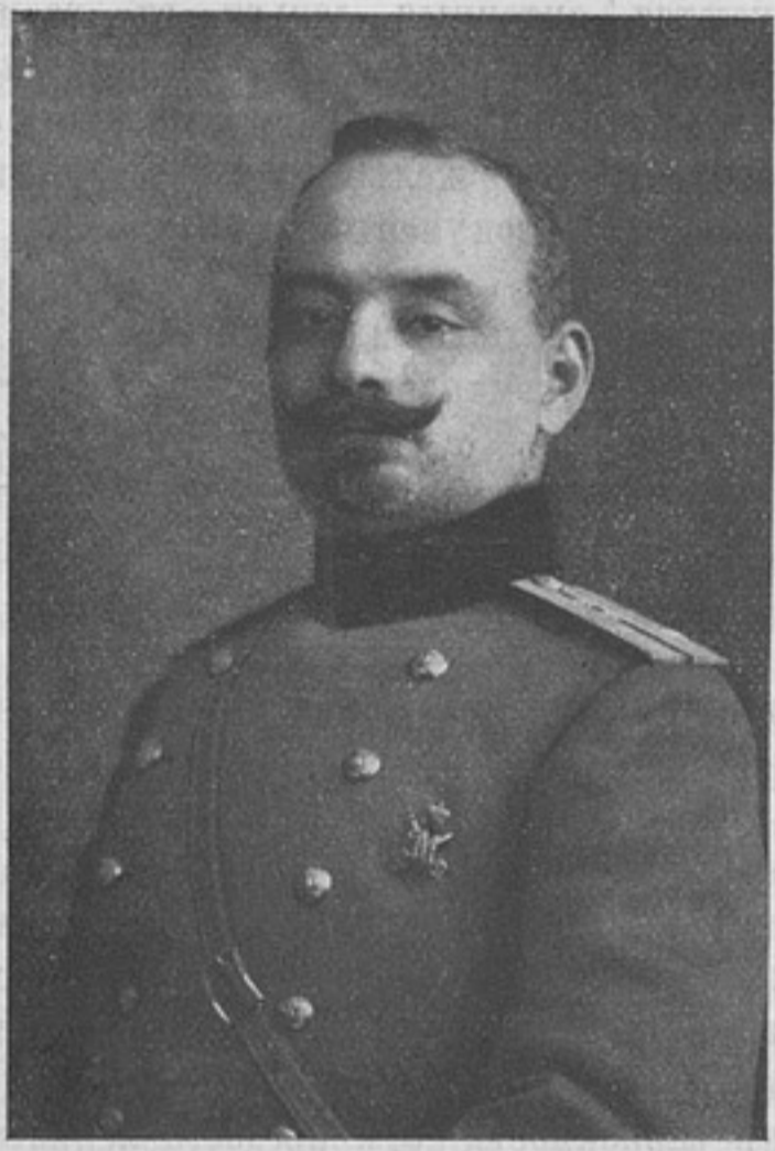
Командиръ 1-й Его Величества батареи л.-гв. конной артиллеріи полковникъ