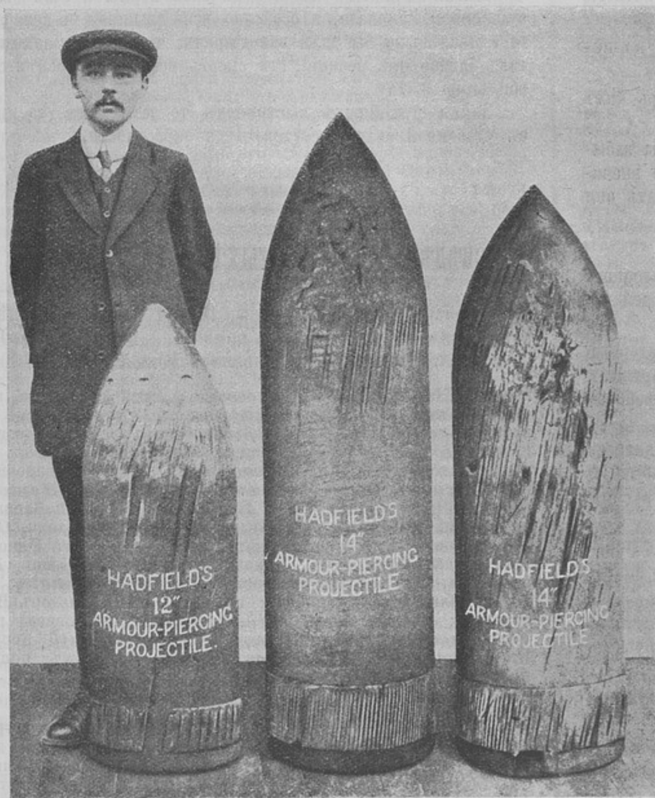
Англійскія бомбы 12 и 14-дюйм. калибра, пробившія 12-ти дюймовую цементованную броню завода Круппа, съ разстоянія въ 8 верстъ. Онѣ были найдены въ 3 верстахъ позади брони.

Обрывки марли, бинты, клочья ваты, тряпье грязное, зловонное.