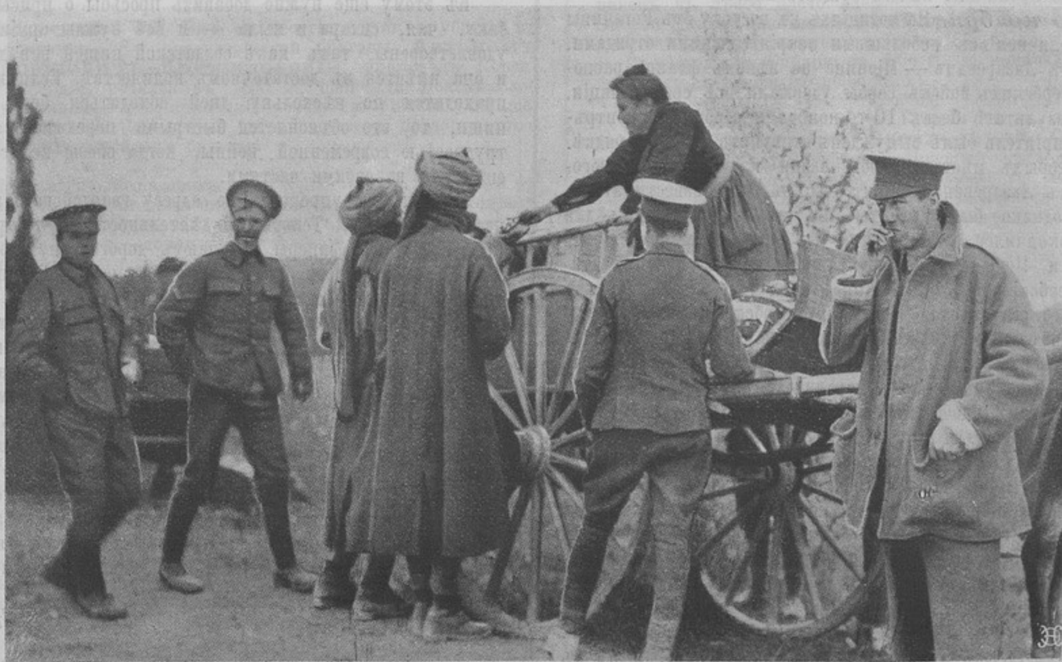
Съ театра военныхъ дѣйствій. Французская маркитантка среди англійскихъ войскъ.

8-го ноября. Въ теченіе 8-го ноября происходило сраженіе на фронтѣ Лазаревацъ—Міоница. Въ тотъ же день сербская тяжелая артиллерія обстрѣляла австрійскіе мониторы, стоявшіе у Землина, и заставила ихъ удалиться. Кромѣ