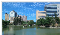
臺大校內的醉月湖