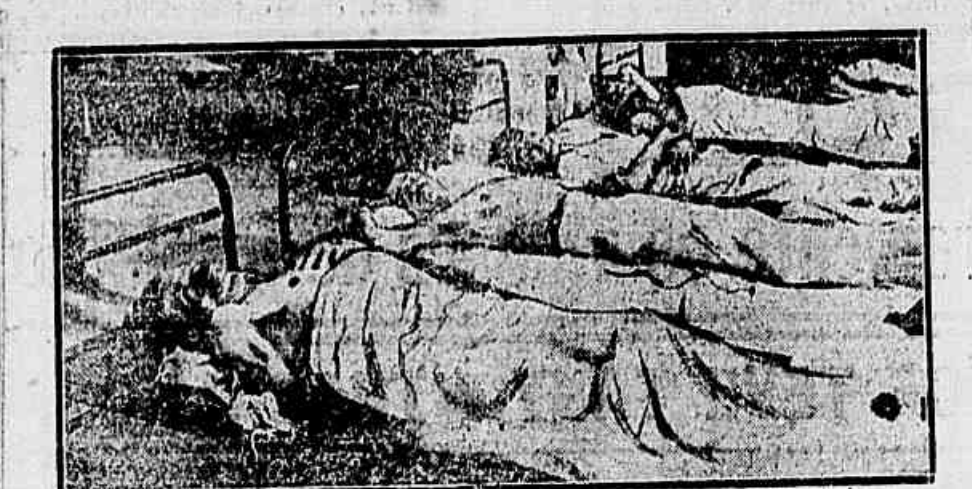
Um aspecto da Assistencia Municipal, após a chegada dos brimceiros insólitos.