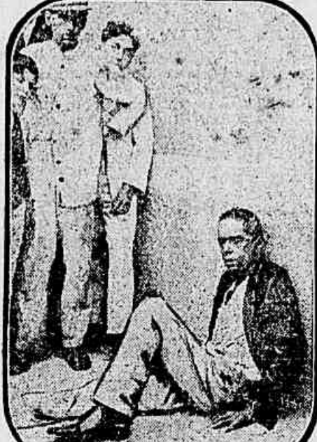
Um pobre homem colhido pela insolação, na manhã de hoje, em frente ao teatro Lyrico

O calor excessivo que tem feito chegar a ser uma calamidade. Os casos de insolação vão dia a dia num crescendo assustador.