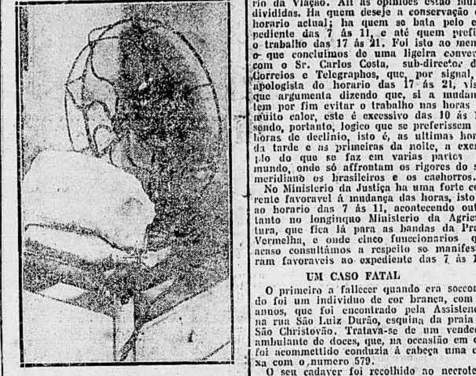
Uma providencia adoptada na Assistencia: um bloco de gelo atraz do pedinte, para refrescar o ambiente, na sala em que se prestam socorros aos insólitos.