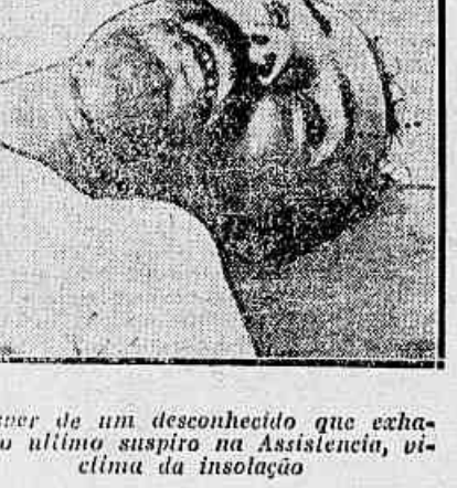
Contender de um desconhecido, que exaltou a ultima suspirio na Assistência, vítima da insolação