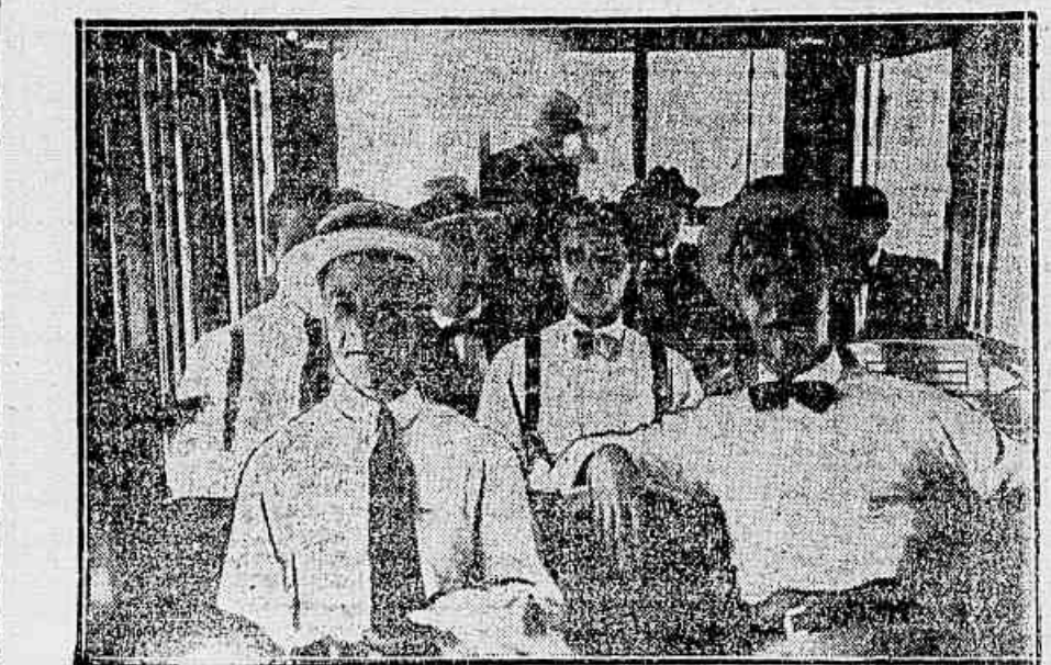
O grupo victorioso consegue assento no tramway

OS SEM PALETOT CONQUISTAM TAMBEM O DIREITO AO BONDE Um calor assim tem que ser combatido a todo transe, com tães como as armas. Dahi o suggerir de idéas aproveitáveis no momento.