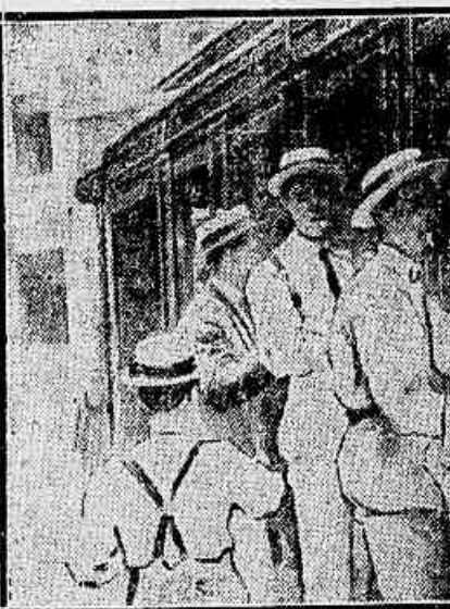
Um grupo dos sem paletot invadindo um bond na rua da Assemblia.