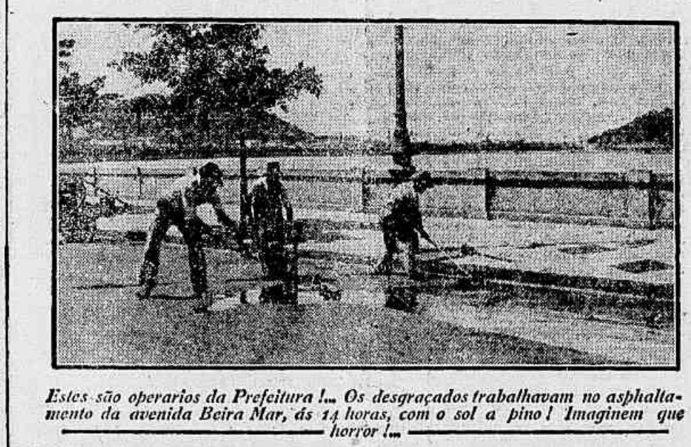
Estes são operarios da Prefeitura!... Os desgraçados trabalhavam no asphalimento da avenida Beira Mar, ás 14 horas, com o sol a pino! Imaginem que horror!