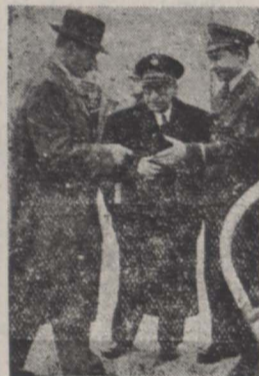
آقای رایت مستشار سفارت انگلیس هنگام عزیمت در فرودگاه مهر آباد بقیه در صفحه چهارم

وی بخبر نگار ما گفت من محیط سیاسی ایران و افکار و نظریات مردم و دولت ایران را در مورد مسئله نفت برای دولت متبوع خود تشریح خواهم کرد