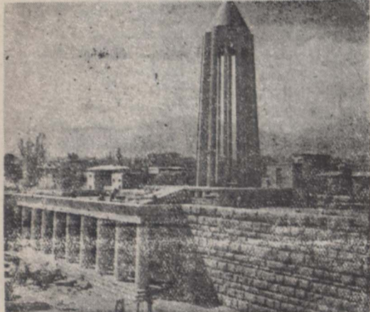
بنای آدامگاه بوهلی سینا که از مذمتی پیش تکمیل و آماده شده است

جواب قبولی کلیه دعوت شدگان تا پایان این هفته واصل خواهد شد پروفیسور پوپ، جولیان هاکسلی، پروفیسور جرج کامرون و دکتر لو کهارت در زمره معروفترین دعوت شدگان می باشند