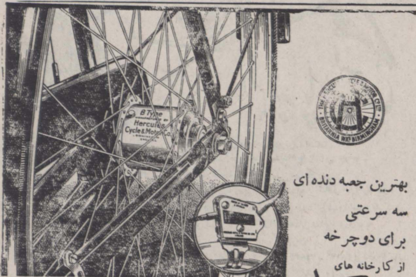
این ترزدستی لوودلیق در هر وضعی میتواند باسانی مورد اطمینان باشد