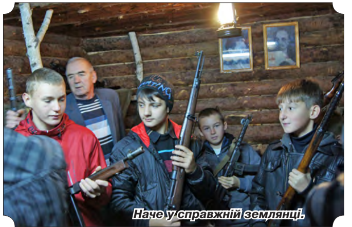
Наче у справжній землянці.