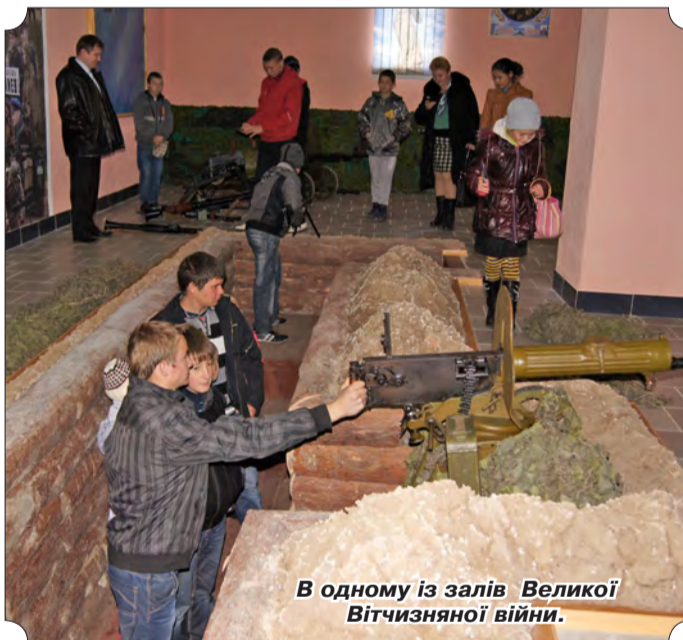
В одному із залів Великої Вітчизняної війни.