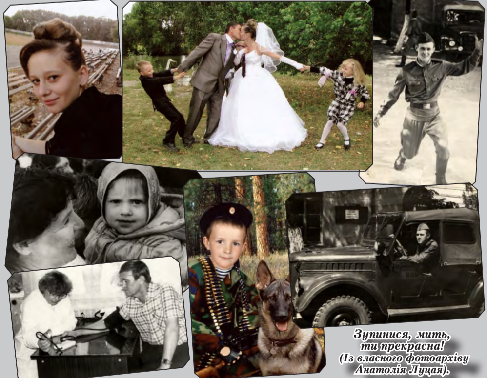
Зунилася, мій, ти прекрасна!.