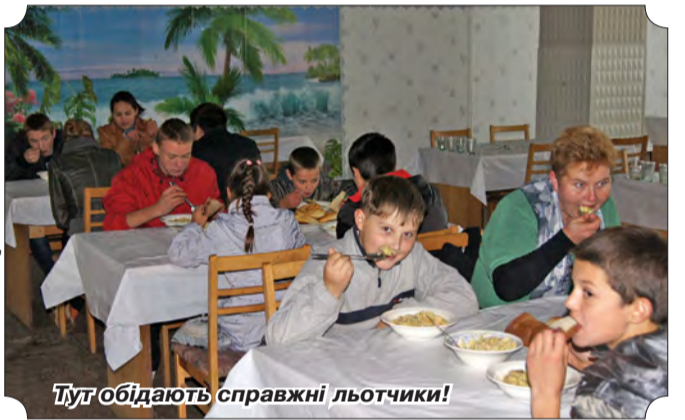
Тут обідають справжні льотчики!

школярів невеличкий набір письмового приладдя.