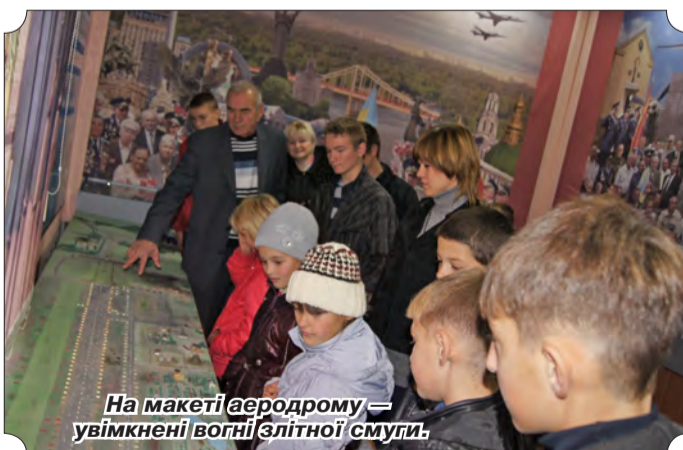
На макеті аеродрому – увікнені вогні злітної смуги.

У найгірші періоди розвитку суспільства проявляються як найкращі, так і найгірші людські риси. І серед найкращих у будь-якому разі домінує патріотизм. Його потрібно пробуджувати, особливо в дітях.