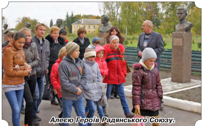
Алеся Героїв Радянського Союзу.