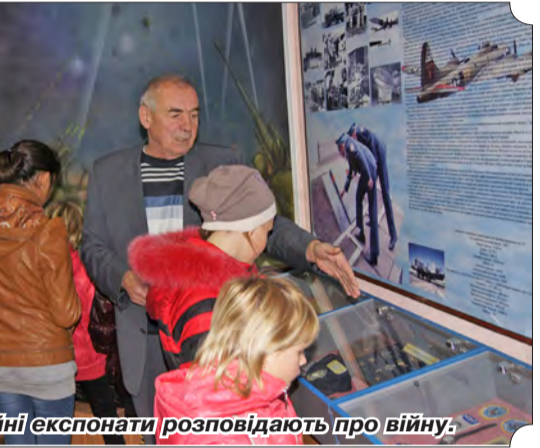
Музейні експонати розповідають про війну.