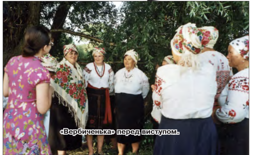
«Вербиченька» перед виступом.

підтримки «Метекс-Агро» та «БЗК», або традиційне Свято села!