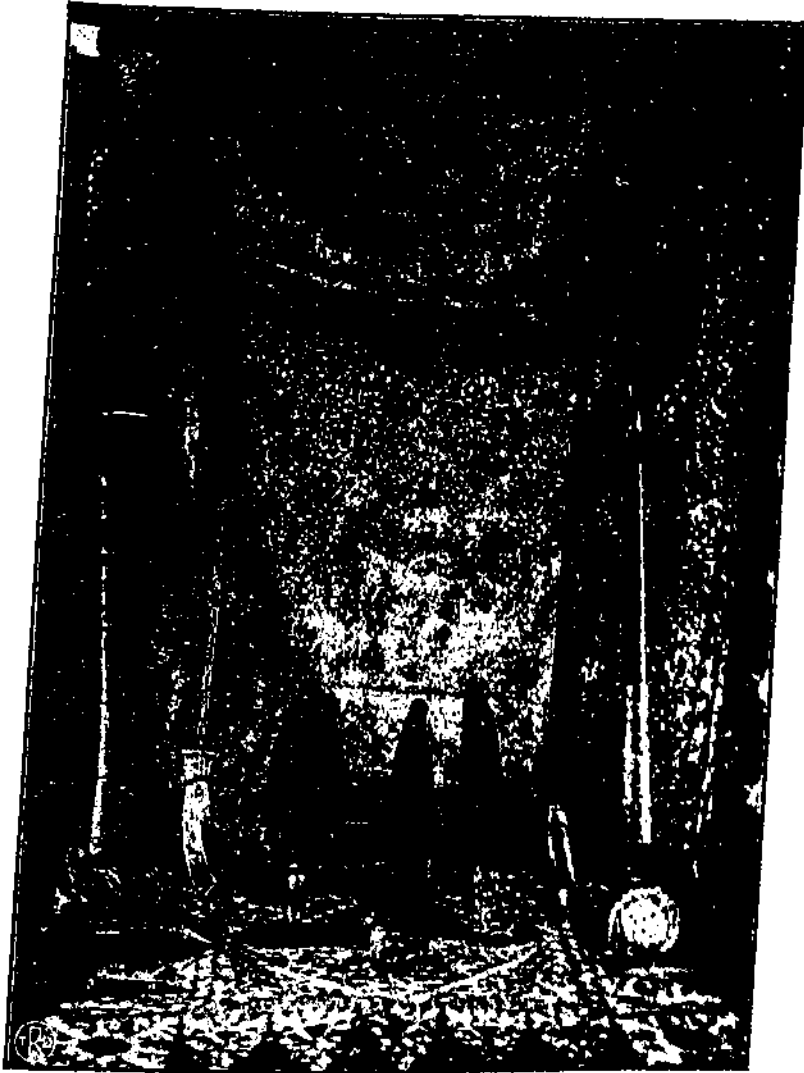
Pusako Karadjaan Alam Minangkabau di Pagurojuang. Sampai kini masih ado.