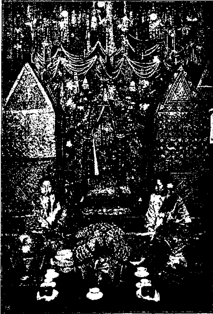
Palaminan tjaro Minangkabau. Suo' kida babanta gadang, batirai barambu-rambu, batakat djo banangameh, batatah djo api-api.