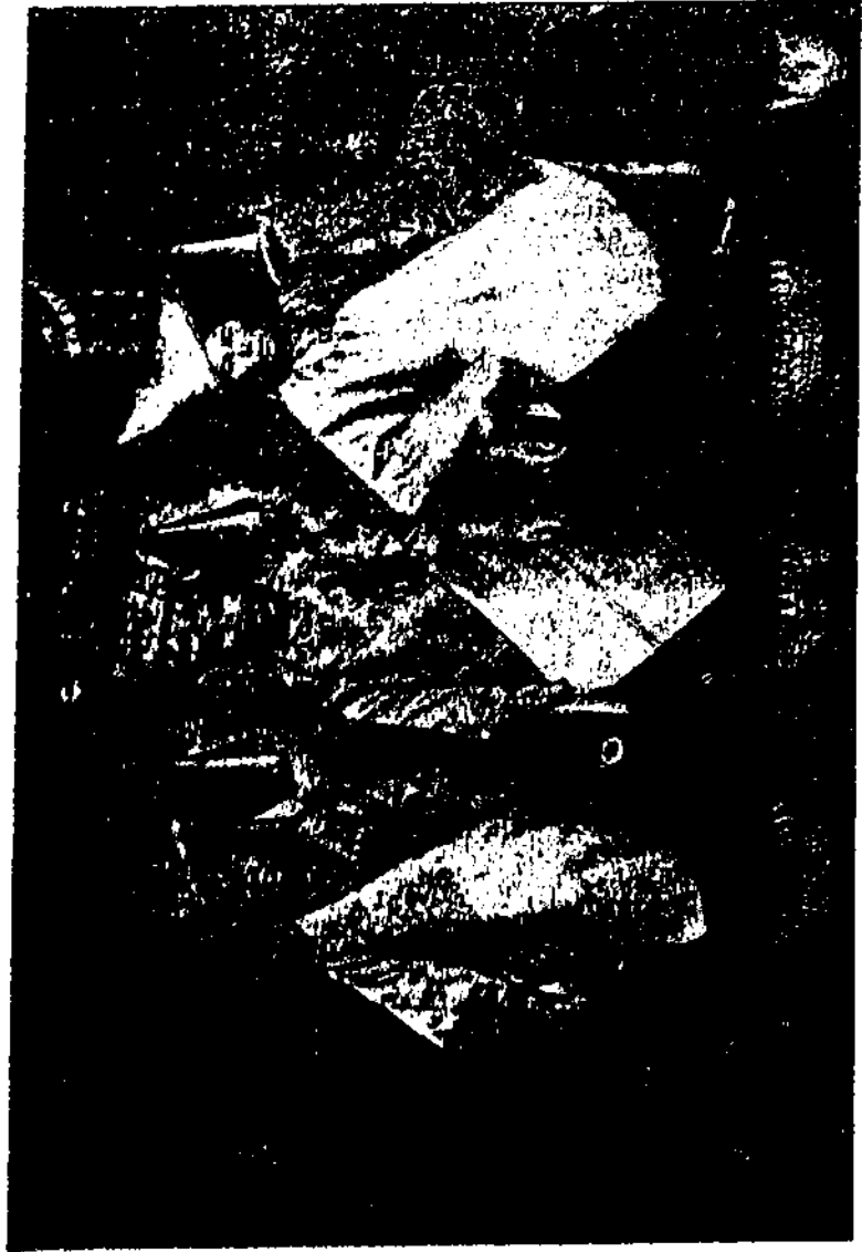
Parampuan-parampuan Minangkabau bapakain adat.