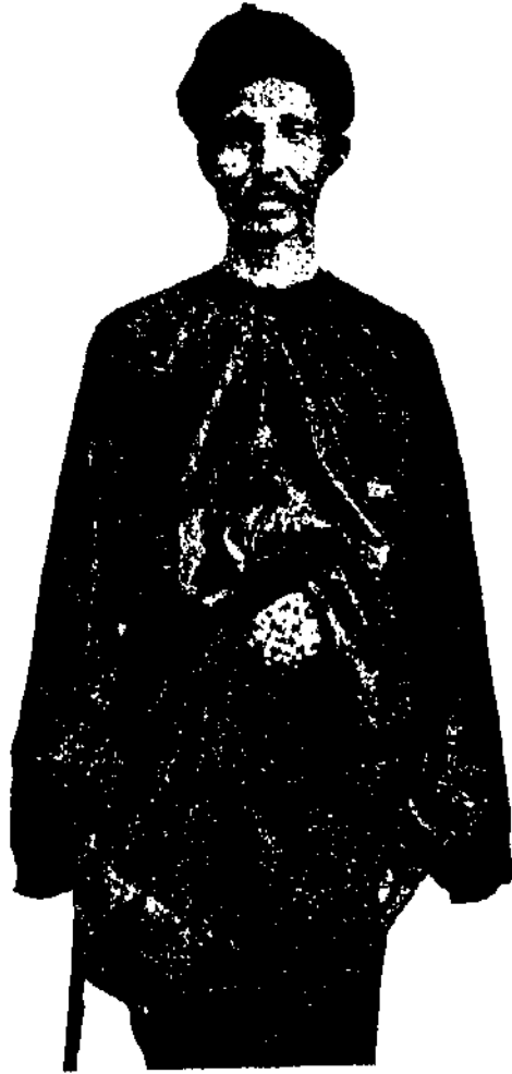
DAT'UE' SANGGUNO DIRADIO BERPAKAIAN ADAT.