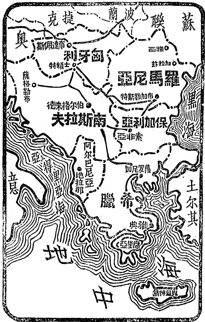
圖勢形島半幹爾巴