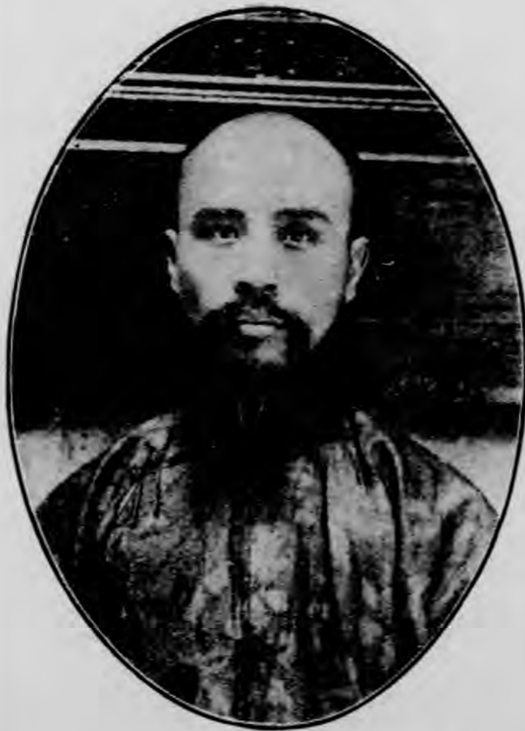
攝 前 元 紀 國 民