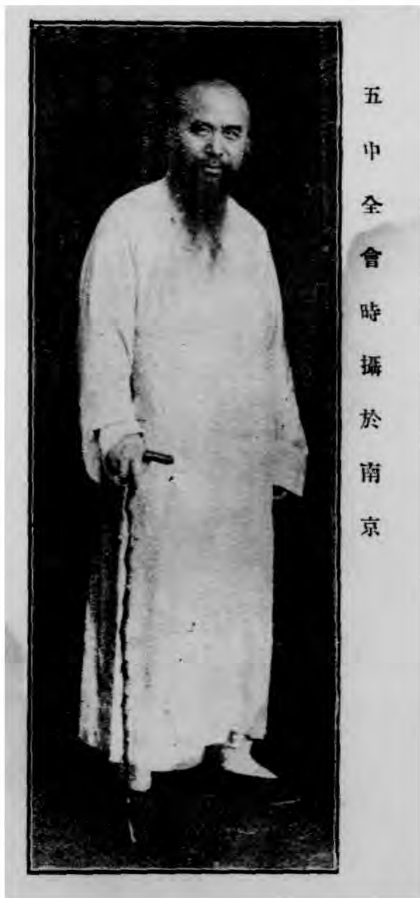
五 中 全 會 時 攝 於 南 京