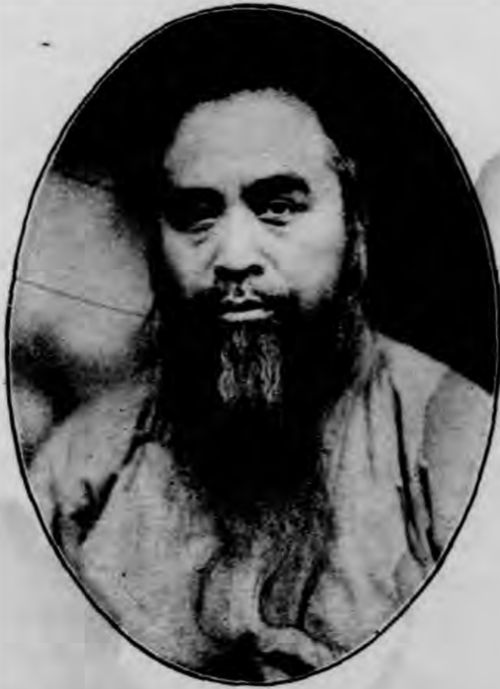
中國國民黨第二屆中央執行 委員會第四次全體會議時攝