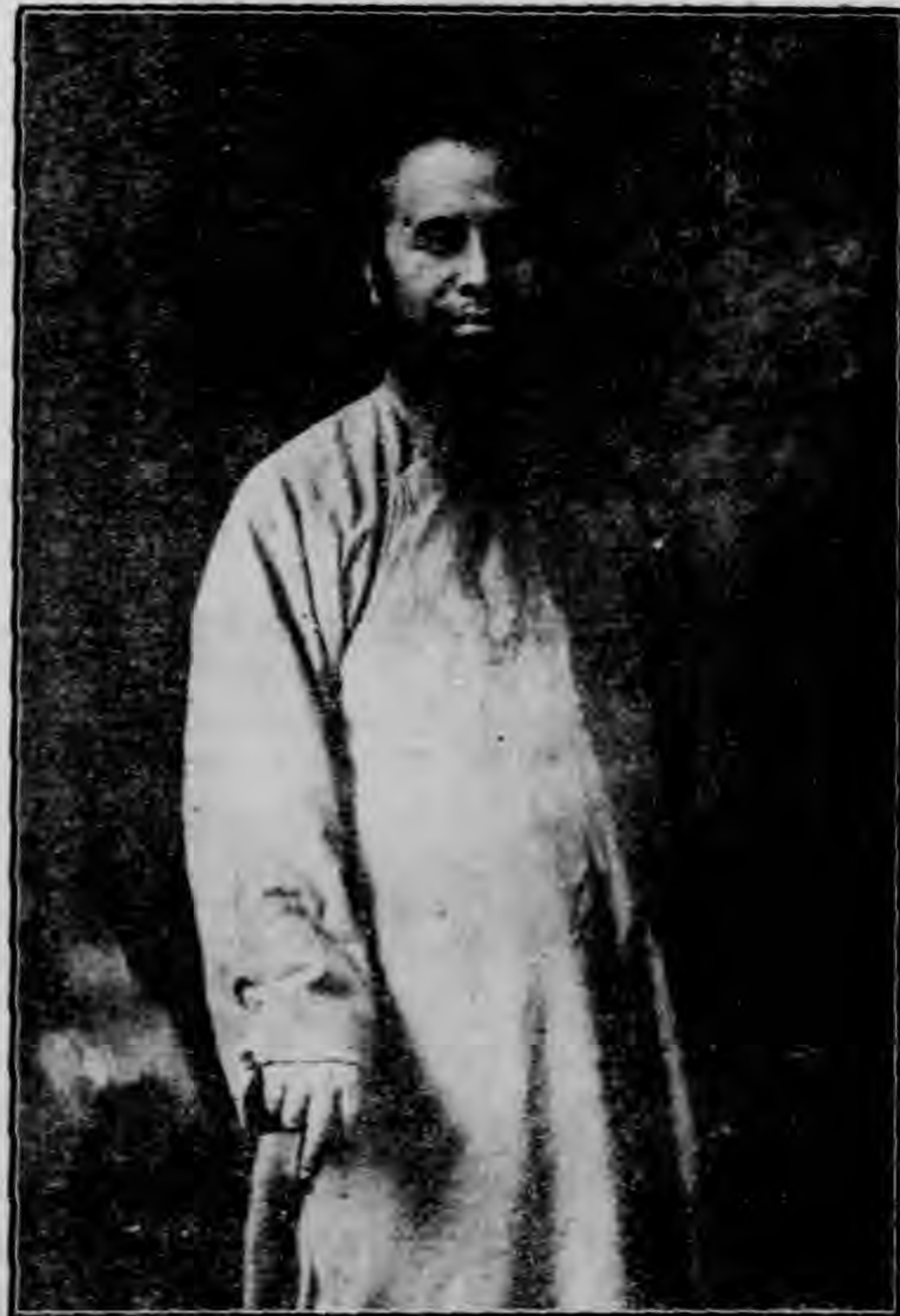
攝 於 俄 京