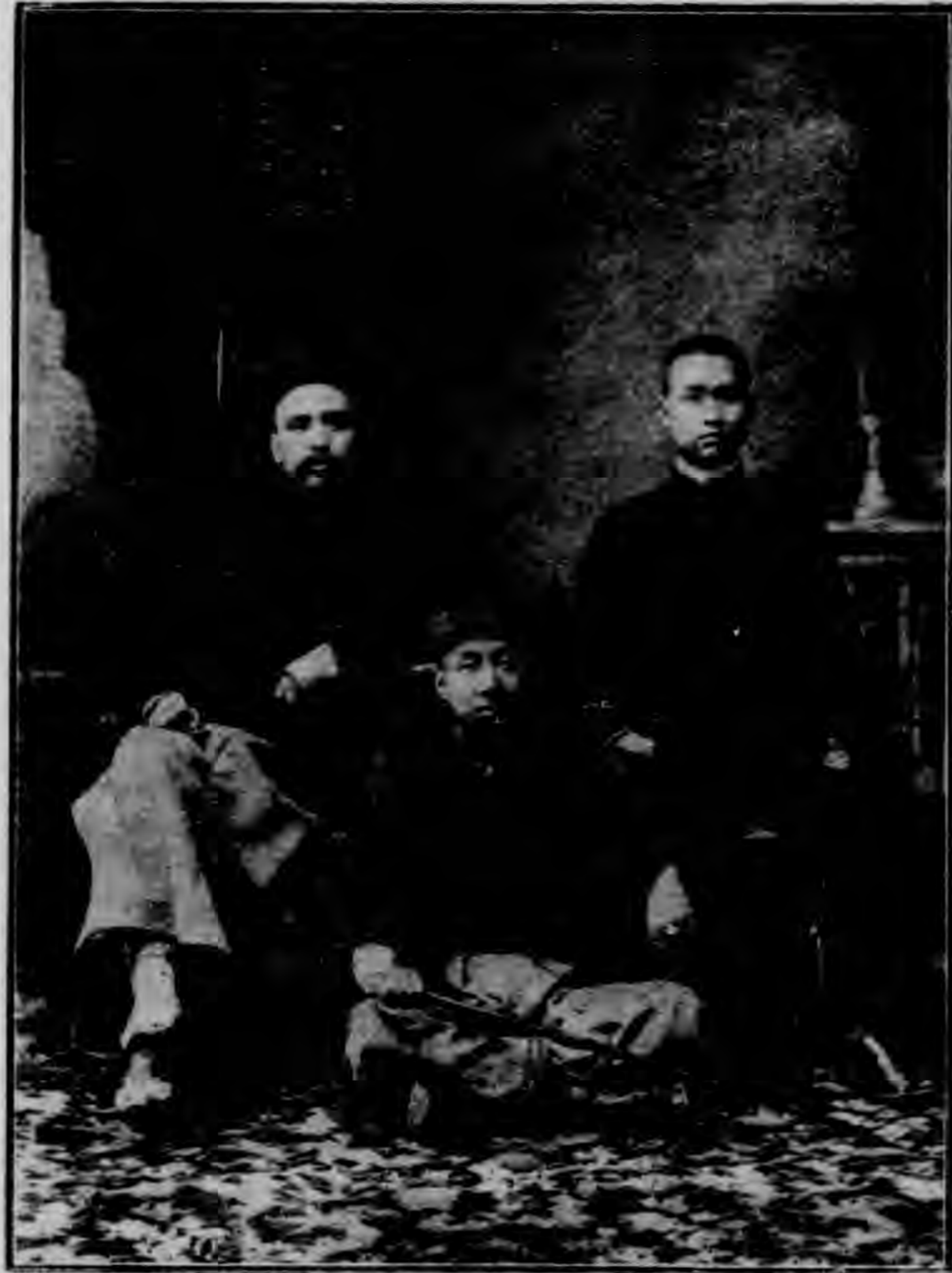
在 日 本 攝 影