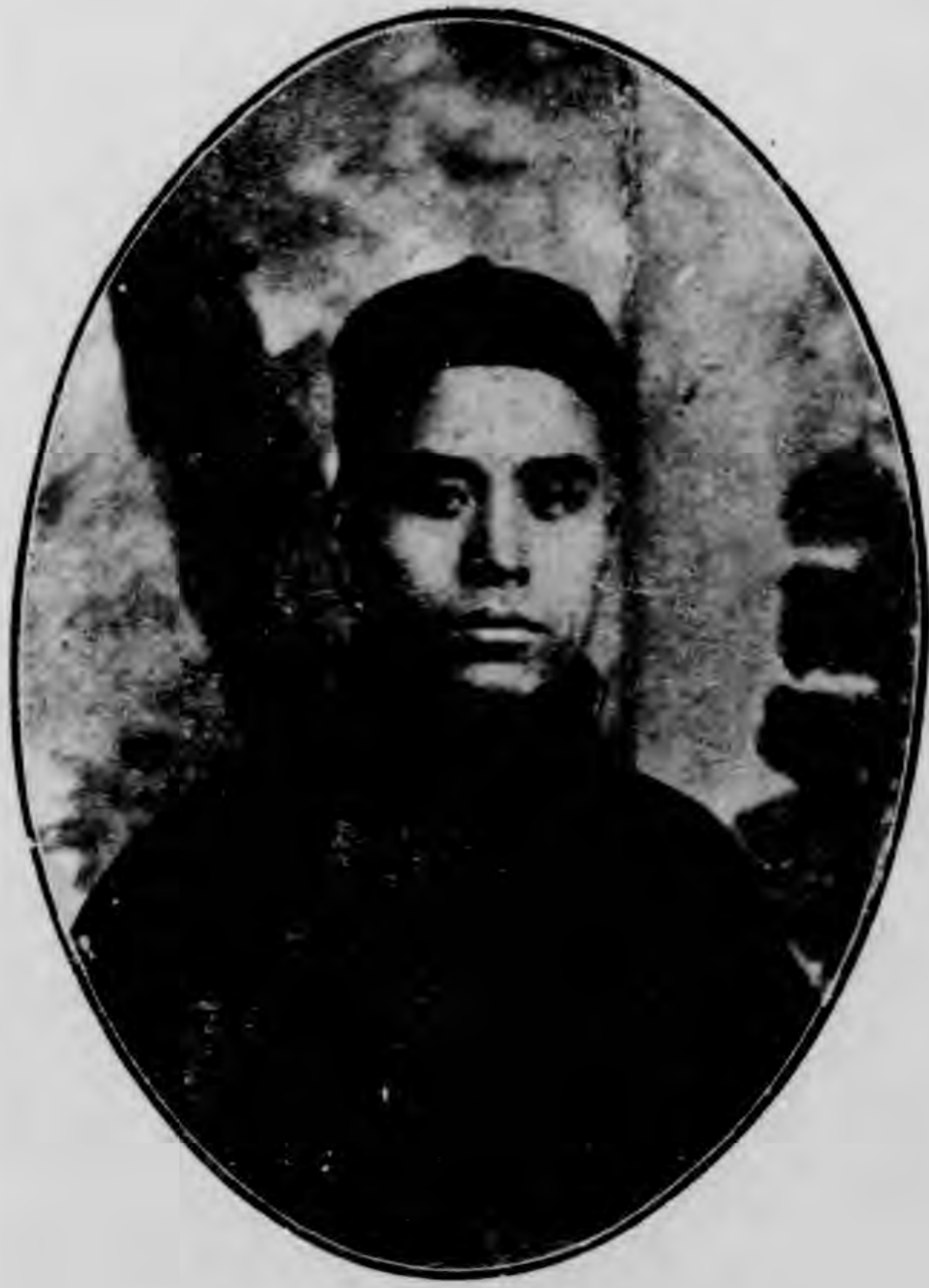
影 攝 前 元 紀 國 民