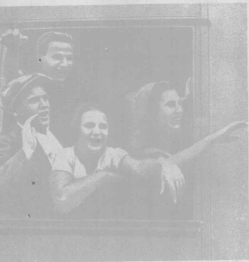
工 作 回 來