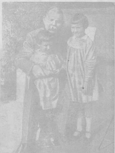
高爾基和他的女孫