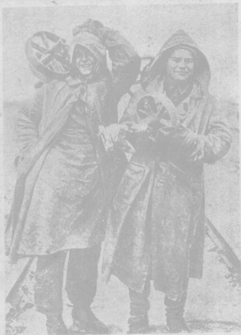
兩 個 得 意 的 青 年 工 人