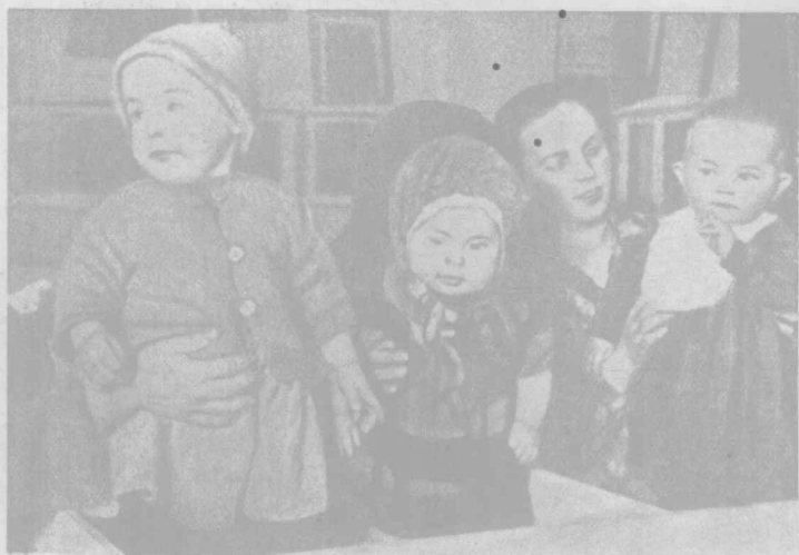
使天小的中手親母在間晚