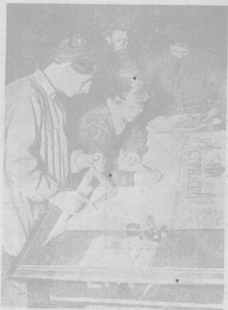
編輯壁報——集體農場的文化事業