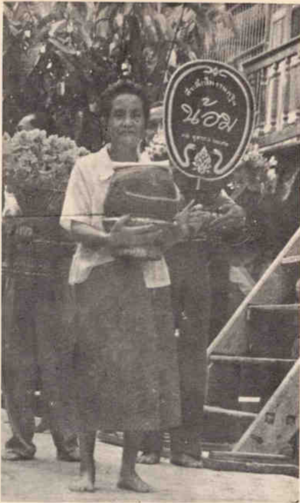
ถวายผ้าพระกฐิน ณ วัดบางขวาง นนทบุรี