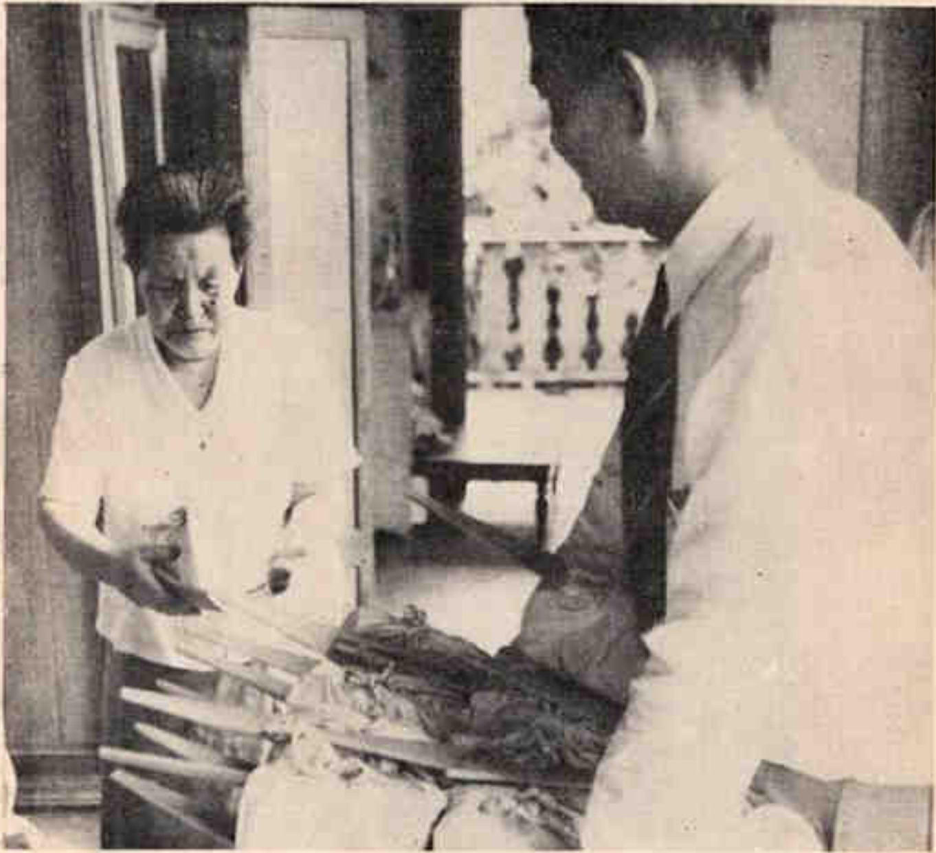
ทำบุญวันเกิดจำไม่ได้ว่าปีใด