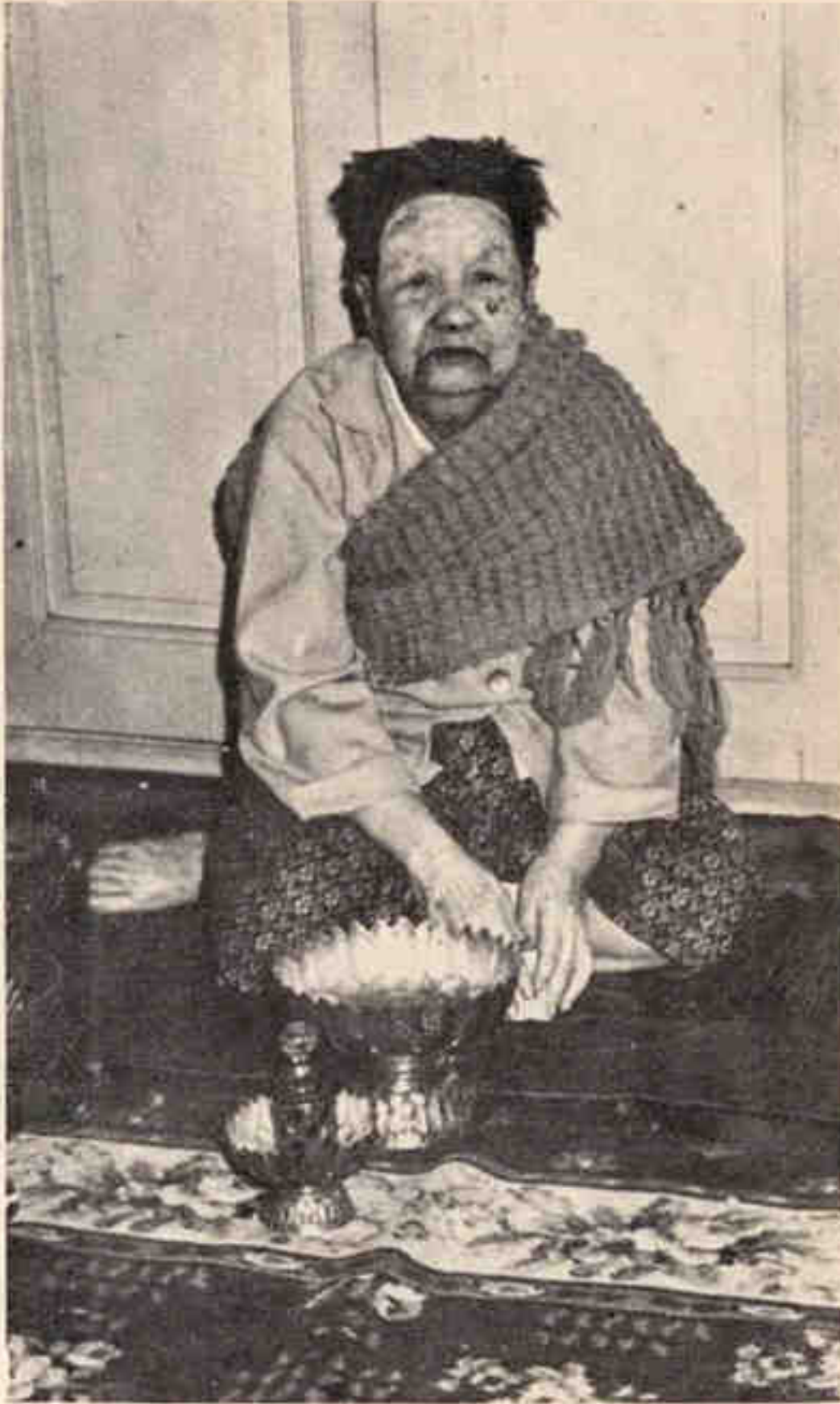
ทำบุญวันเกิด ๒๙ มกราคม ๒๕๐๔