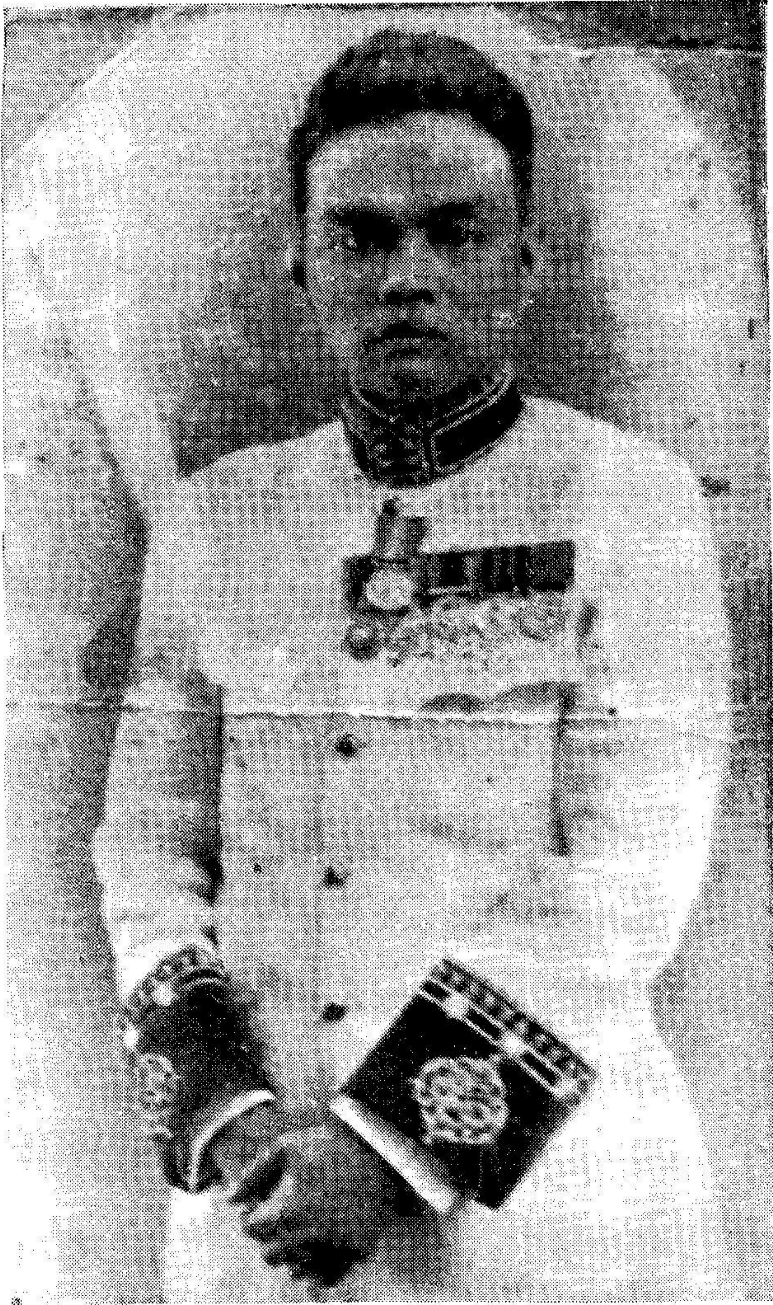
รองอำมาตย์เอก หลวงพิศาลโลหพรค (เปล่ง เวณจันทร์)