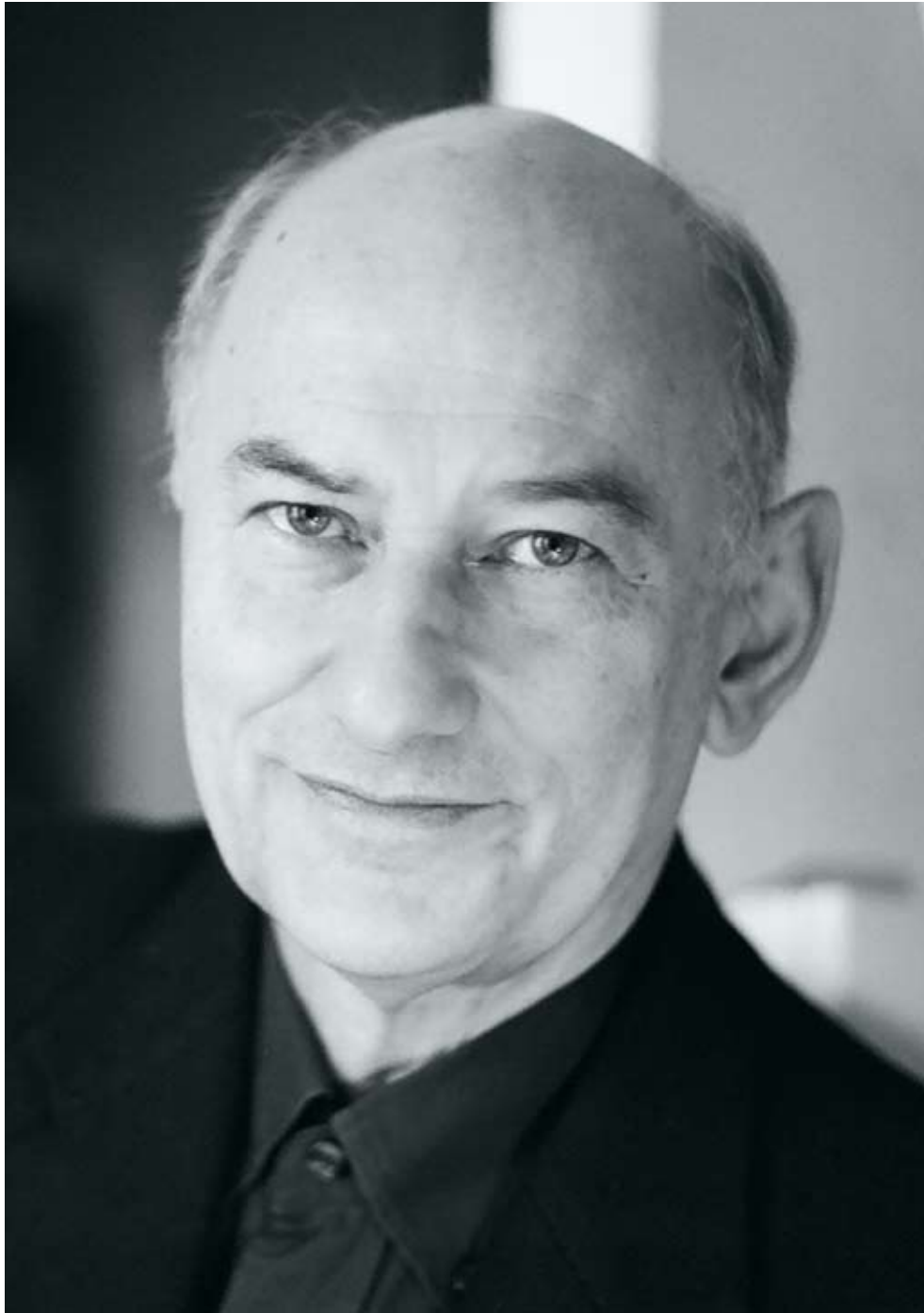
Hugues Dufourt