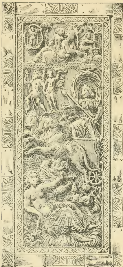
DIPTYQUE EN IVOIRE DE LA BIBLIOTHEQUE DE SENS PROVENANT DU TRÉSOR DE LA CATHÉDRALE