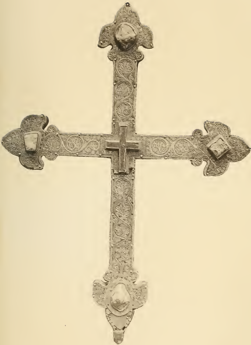
CROIX DE NAILLY Arrondissement de Sens (Yonne).