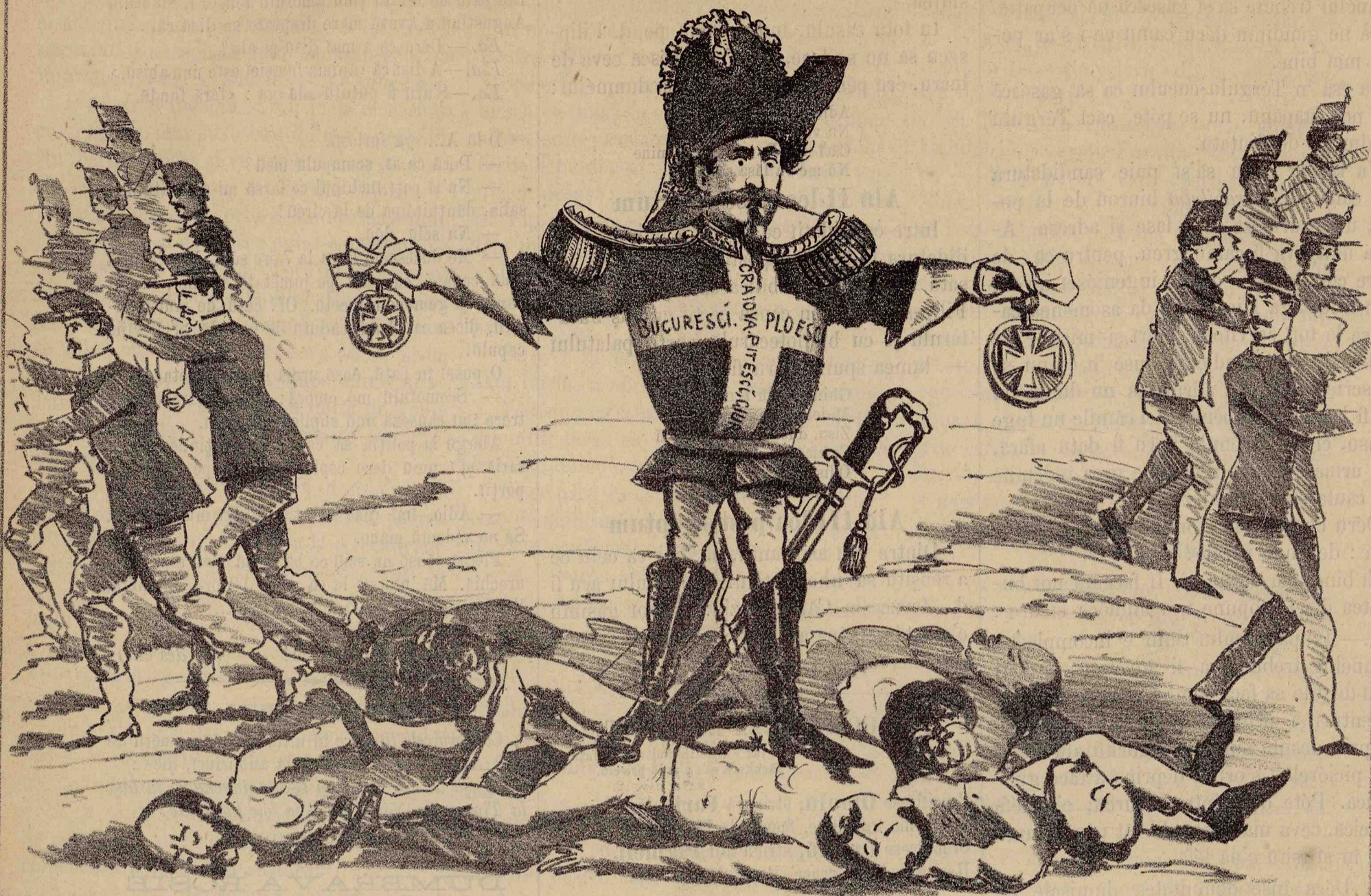
După ce a regularisitu pe Bivolarii din Giurgiu ca mai nainte pe Craioveni, Pitesceni, Ploesceni și Bucureșeni, la 1860 și 1865, astăzi marele spătaru, devenitu ghinăraru de divizie, împarte recompense și medalii militare soldaților, care 'lu iubescu ca șiorecele pe pisică.