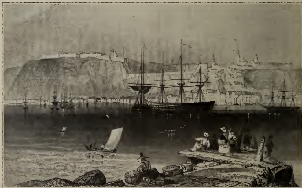
Québec vu de la côte opposée (1840).