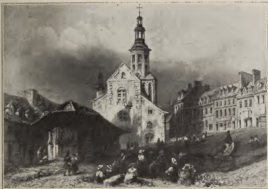
Québec en 1840; la place du marché.

de tendances à sacrifier d'anciennes constructions riches d'histoire, à laisser avilir la beauté d'un site pour des motifs d'un douteux utilitarisme. On a démoli les vieilles portes de la ville... on a élevé de hautes et abominables bâtisses. Québec a déjà été modernisé (1) !