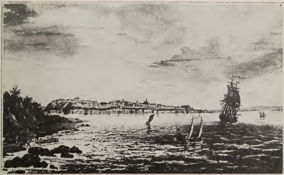
Vue de Québec, prise en 1784 de la pointe Lévi.