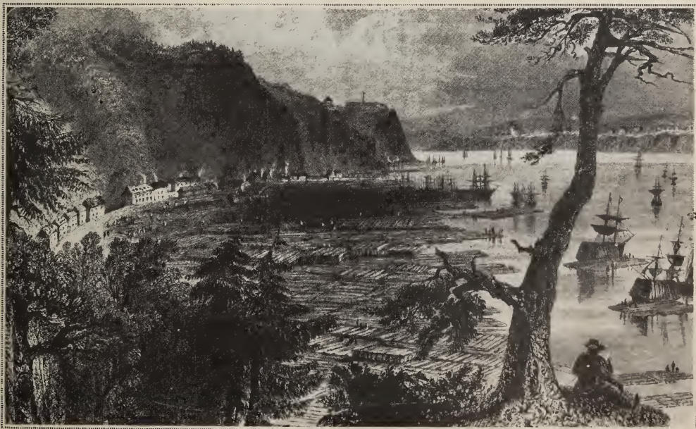
Dépôt de bois près de Québec (1840).