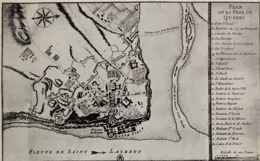
Plan de Québec (vers 1740).