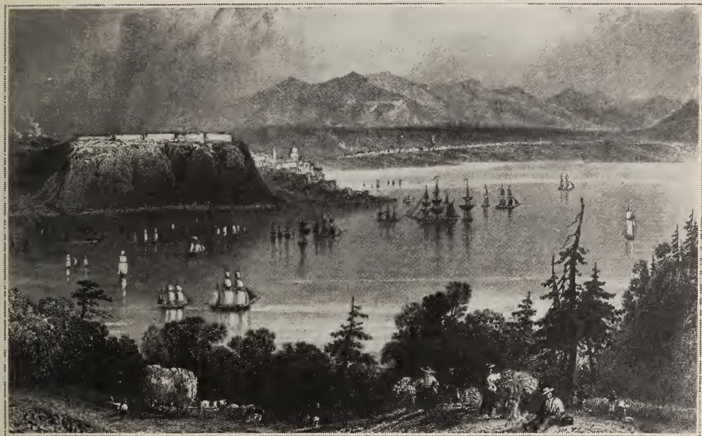
Québec en 1840; la rade et la citadelle.