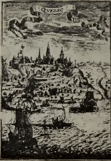
Vue de Québec (deuxième moitié du XVII e siècle).

Québec nous est remis le 13 juillet 1632, en ruines. Champlain consacra les trois dernières années de sa vie à les relever et à poursuivre inlassablement la réalisation de ses vastes et admirables projets.