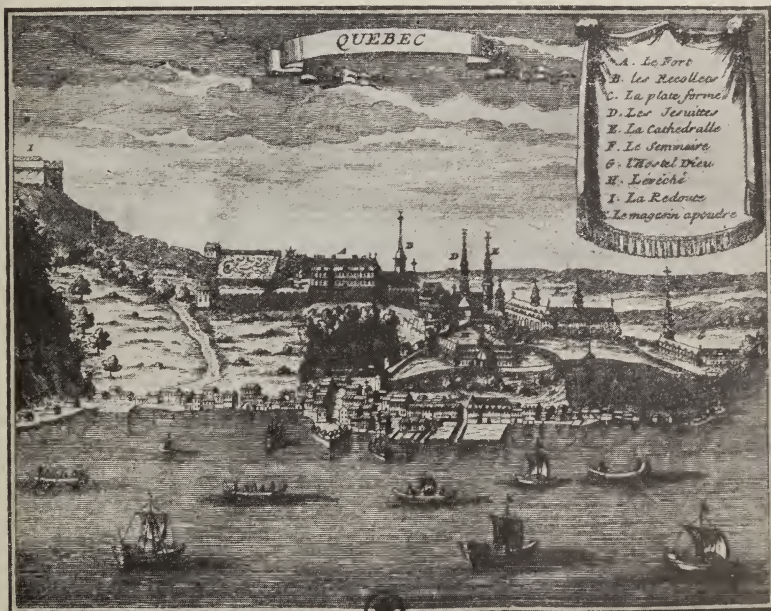
Vue de Québec (fin du XVII e siècle).

Neuvième collier. — « Il n'y avait plus de chemin de paix, les bois et les rivières étaient gâtés, que le chemin soit libre présentement jusqu'à Ounontaté ; je le débouche par ce collier afin que notre père quand il voudra nous faire savoir sa volonté le puisse faire en sûreté, l'assurant que ceux qui y viendront de sa part seront bien reçus, et que je prépare par ce collier la natte à Ounontaté qui est le lieu où nos affaires importantes se traitent. »