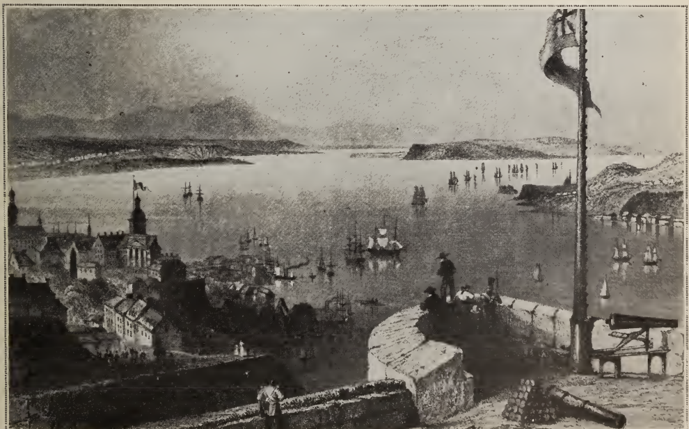
Vue prise de la citadelle de Québec en 1840.