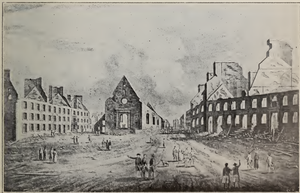
Québec après le siège de 1759.