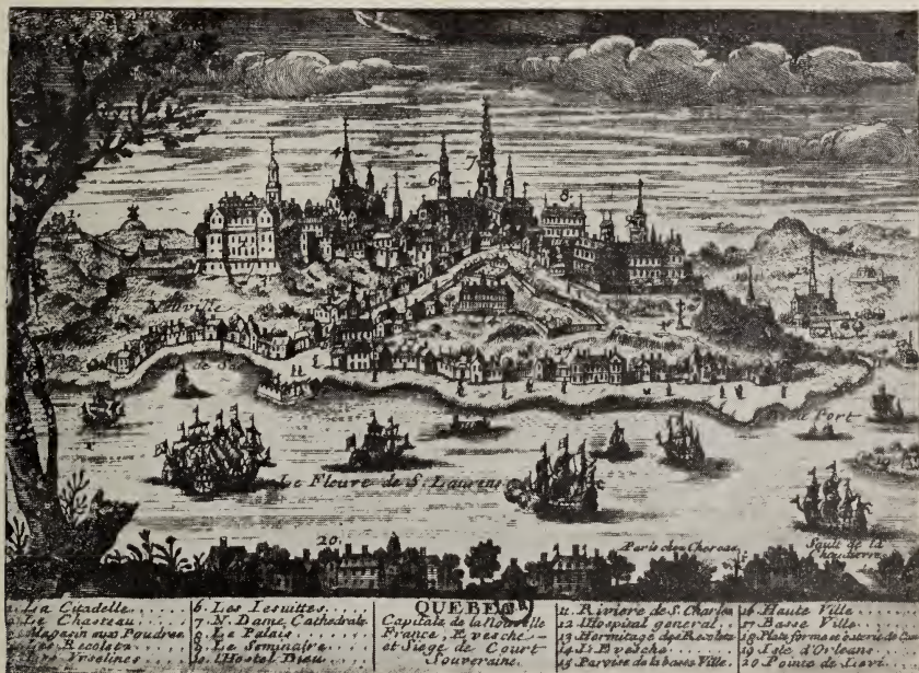
Vue de Québec (première moitié du XVIII e siècle).

rivières, qui forment ce port, découvriront de belles prairies, de riches coteaux et des campagnes fertiles. et il ne leur manque pour cela que d'être plus peuplées; qu'une partie de la rivière Saint Charles, qui serpente agréablement dans un charmant vallon, sera jointe à la ville, dont elle sera sans doute le plus beau quartier; qu'on aura revêtu la rade de quais magnifiques; que le pont sera environné de bâtiments superbes, et qu'on y aura trois ou quatre cents navires chargés de richesses, que nous n'avons pas encore su faire valoir, et y apporter en échange celles de l'Ancien et du Nouveau Monde, vous m'avouerez, Madame, que cette terrasse offrira un point de vue, que rien ne pourra égaler, et que dès à présent ce doit être quelque chose de fort bien.