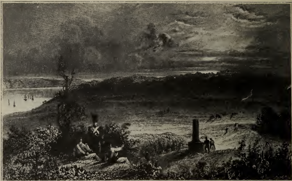
Les plaines d'Abraham (1840)