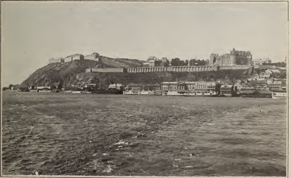
Québec actuel. — Vues générales.