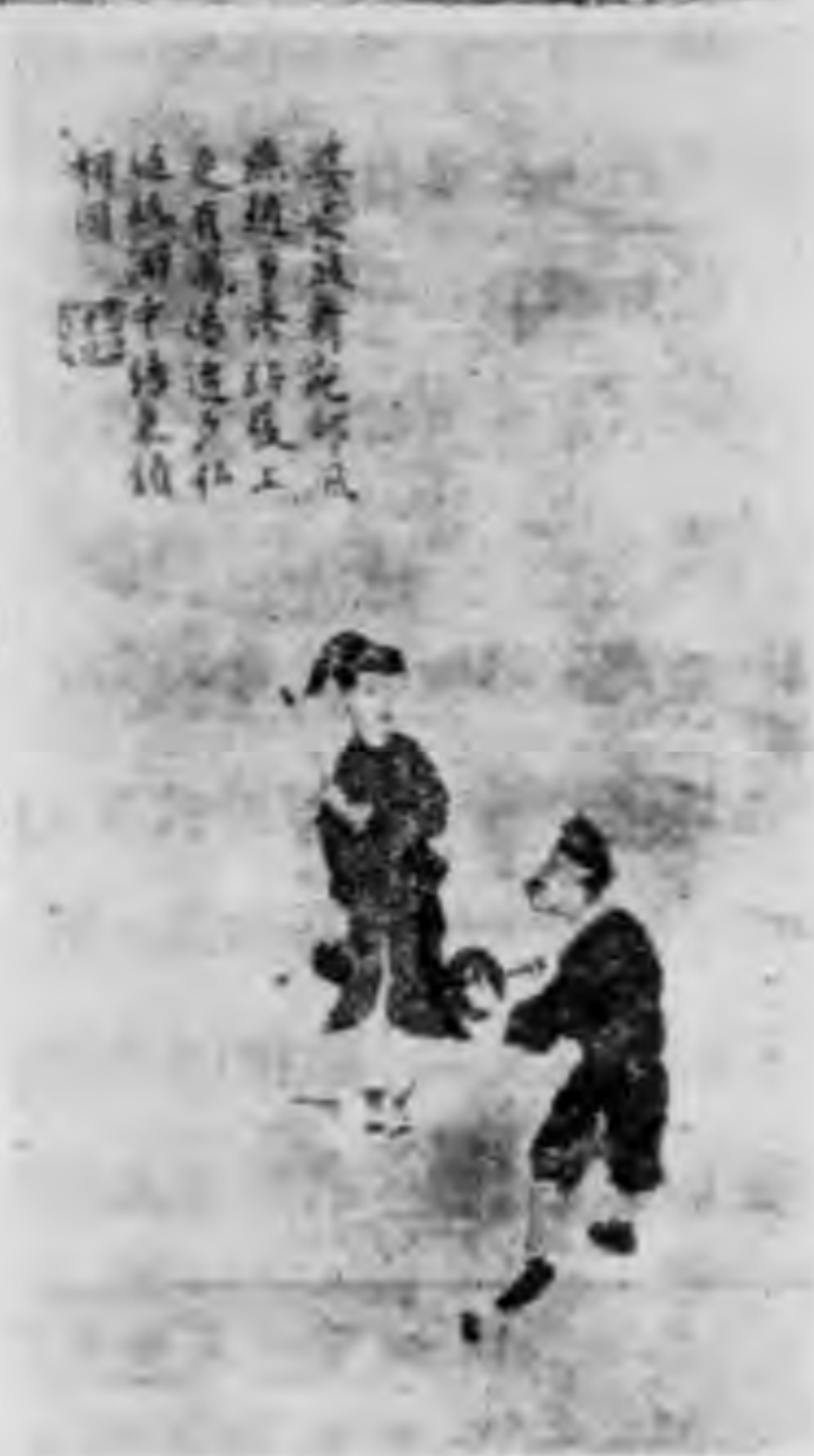
第 四 圖