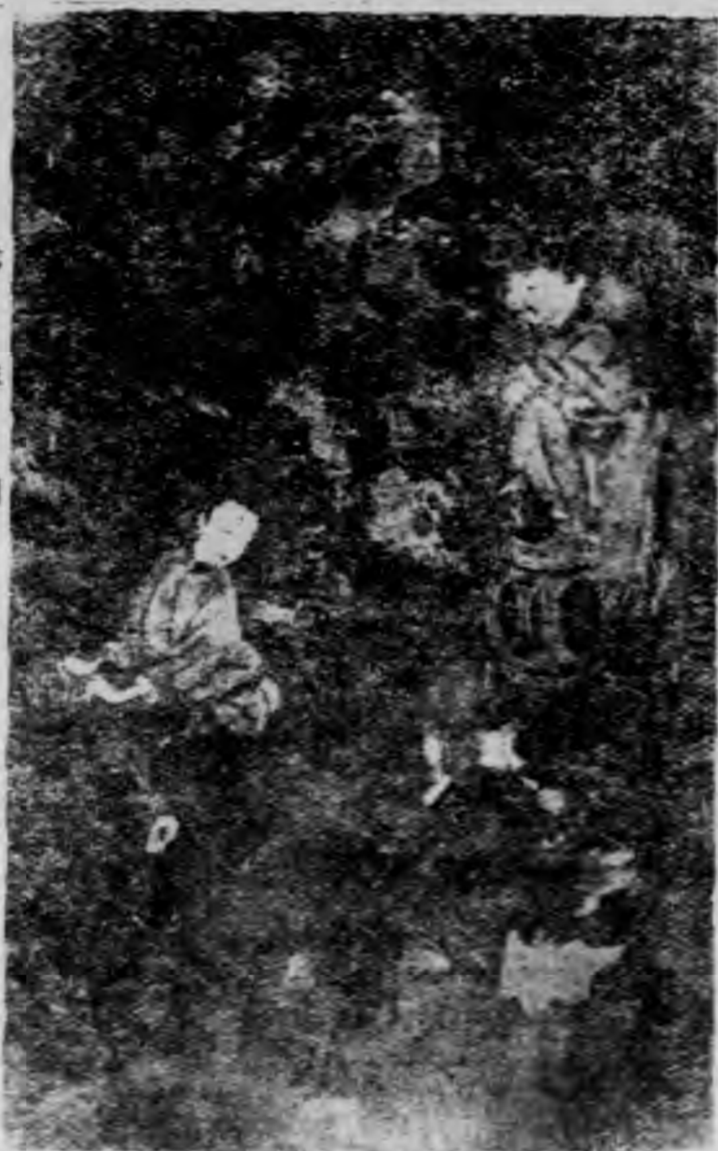
第 三 圖

美國波士頓美術館藏有明人顧貞龍所繪花鼓圖一幅(圖三)，是畫一官人在花園裏看打花鼓。官人正式衣冠，脚登鼓凳，傾身靜觀，狀似明人所繪李太白模樣。一鄉下女子，高髻短襖，挽袖曬腰，手打兩頭鼓，回顧同伴。一鄉下男子，稍有鬚鬚，背負小兒，手打小鑼，作與婦人相應之式。假山石後，梅花正開，表示看打花鼓在冬末春初時也。顧貞龍是吳江人，他所畫的這種打花鼓的情形，正可以代表 明末江南 一帶隨地賣唱的打花鼓。