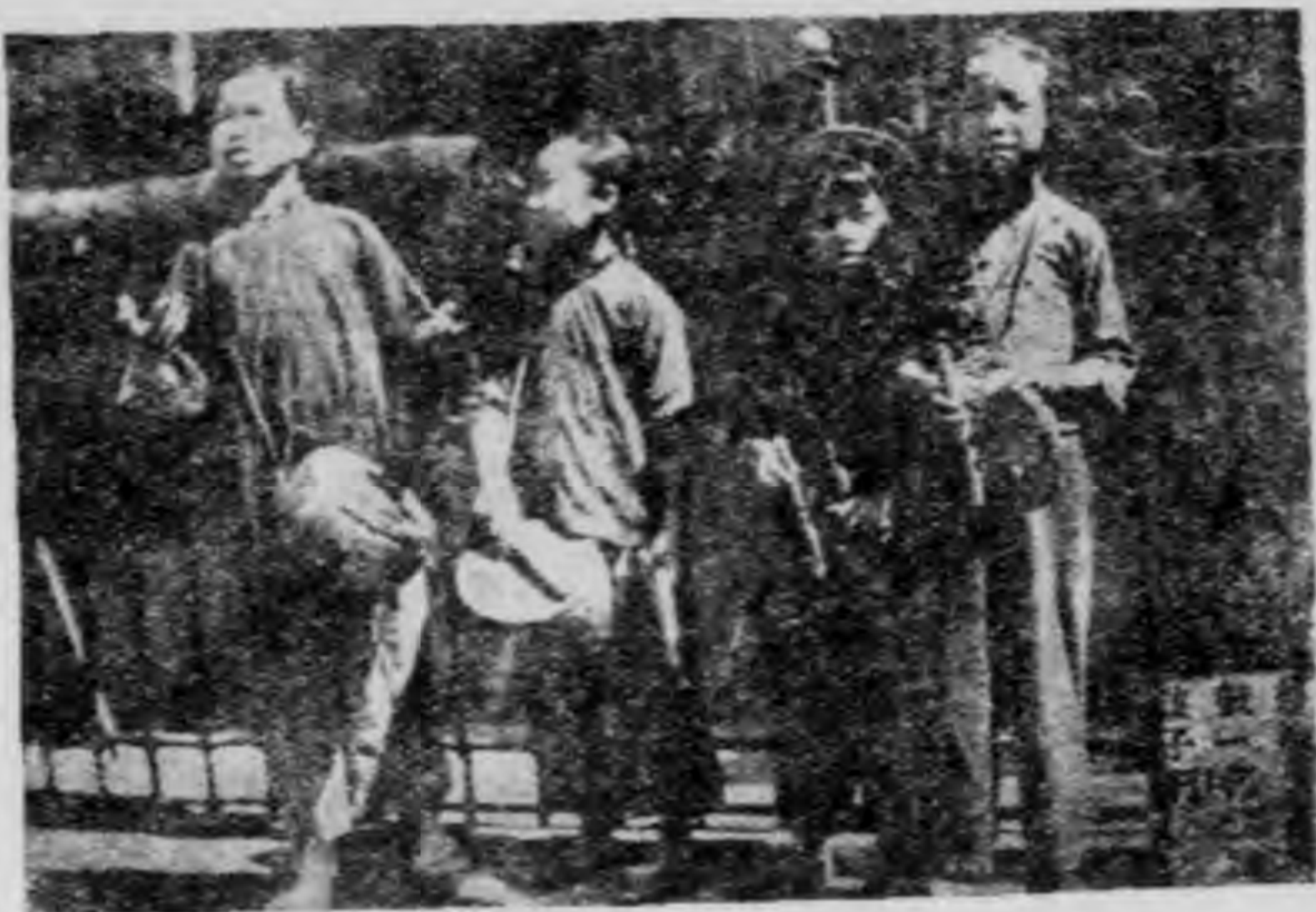
第 二 圖

上面所說的只是打花鼓中之一種，已歷年一千餘載，有三杖鼓，花鼓棒，花鼓槌，三棒鼓，三根棒，三根頭，等名稱。演的人有婦女，有男子，有和尚，有乞丐。到現在則多是 江北 童子打着要錢了（圖二）。