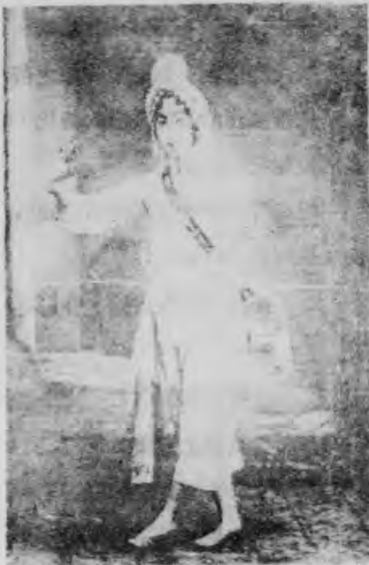
第 六 圖

花鼓婦人用布巾包頭，這也是前後相同的觀念，因為要表示其為 鳳陽 鄉下人的原故。後來花鼓戲隨着二簧戲日趨奢麗，打花鼓的女子，滿身錦繡（如圖六），然而仍作鄉下女子形像，這也是始終沒有變的。