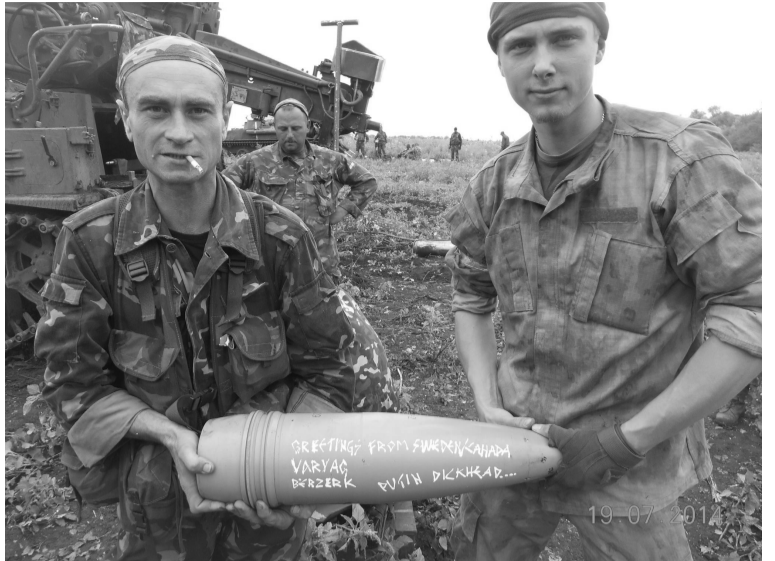
Фото за два дні перед тим, як він героїчно загинув під Луганським аеропортом, прикривавши відхід пораненого побратима. “Типовий петлюревець, антибольшевик і патріот. Приклад для наслідування. Люблячий чоловік і батько двох дівчат”, – так написав про нього товариш.

Типовий петлюревець, антибольшевик і патріот. Приклад для наслідування. Люблячий чоловік і батько двох дівчат, – так написав про нього товариш. Вічна пам’ять!