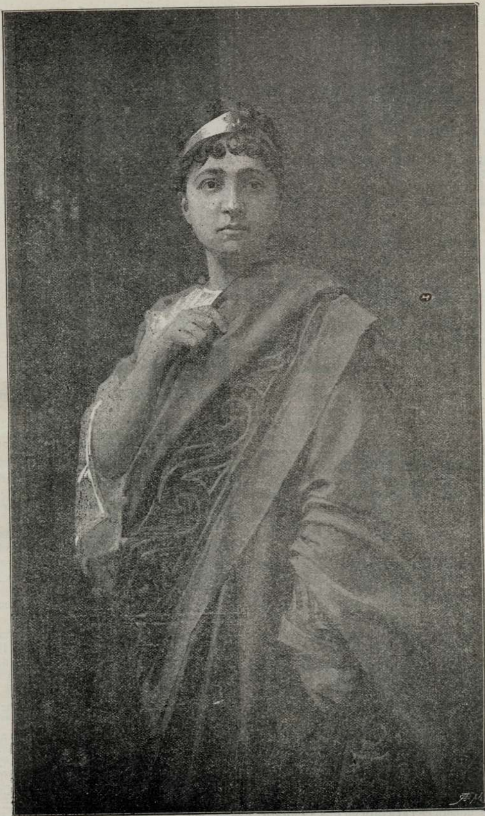
SOCI'A LUI MILTIADE.