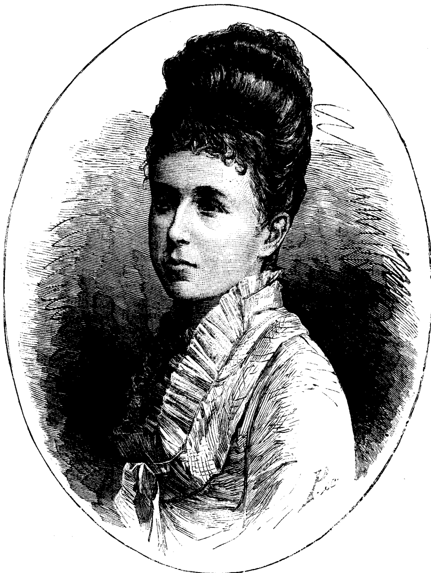
Regin'a Cristina a Spaniei.