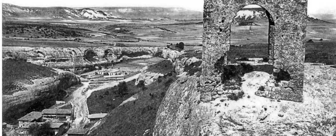
Вежа Киз Куле («Дівоча вежа» по-татарськи) поблизу Черкез-Кермана