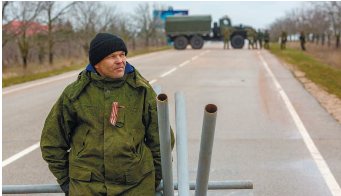
Блокпост так званої «самооборони» біля аеродрому «Бельбек»

На нічні патрулювання виїжджали парами на власних автівках офіцерів та контрактників частини. Обов'язково в цивільному одязі. Зброю – пістолети та автомати – з собою не брали, брали холодну чи ударну зброю. Особисто я брав свій ніж «Кізляр Єгерський» з довжиною леза 20 см. Розміщувалися на під'їздах до частини і, не привертаючи до себе уваги, спостерігали за дорогами та пересуванням тран-