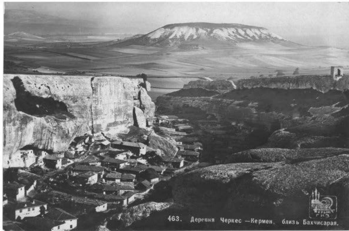
Черкез-Керман. Фото 1912 р.

Це, звичайно, винятковий, поодинокий випадок. Нам просто-напросто пощастило. А взагалі, з району в район не те, щоб переїжджати, але і в гості ходити заборонялося. Всі кримські татари, починаючи з 16 років, як і інші