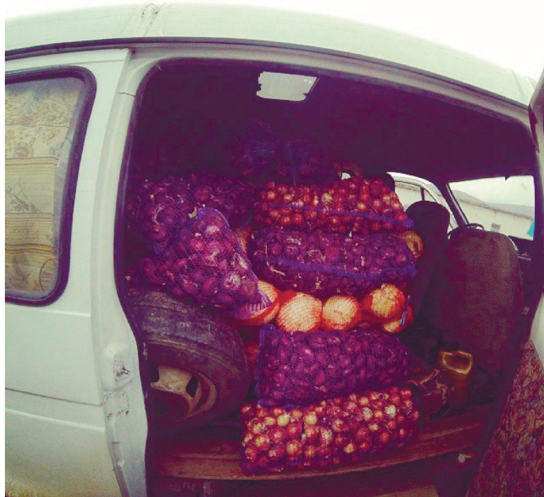
Кримський фермер привіз повну «Газель» овочів для українських військових, заблокованих у Перевальному

шерстому напівкамуфльованому напівводязі. Вони вільно пересувалися півостровом.