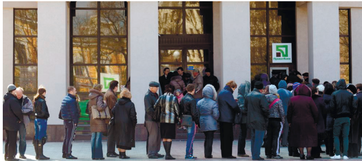
Люди стоять у черзі до банкомата в Сімферополі, весна 2014 року

спорту. Відслідковували групи автобусів, на яких зазвичай пересувалася кримська «самооборона», підозрілі авто та транспорт окупантів, та доповідали про це на КП бригади черговому офіцеру. Паралельно з нами таким самим методом трасу патрулювали кримські татари та «самооборонівці», періодично під'їжджаючи та цікавлячись, чого ми тут стоїмо і що робимо.