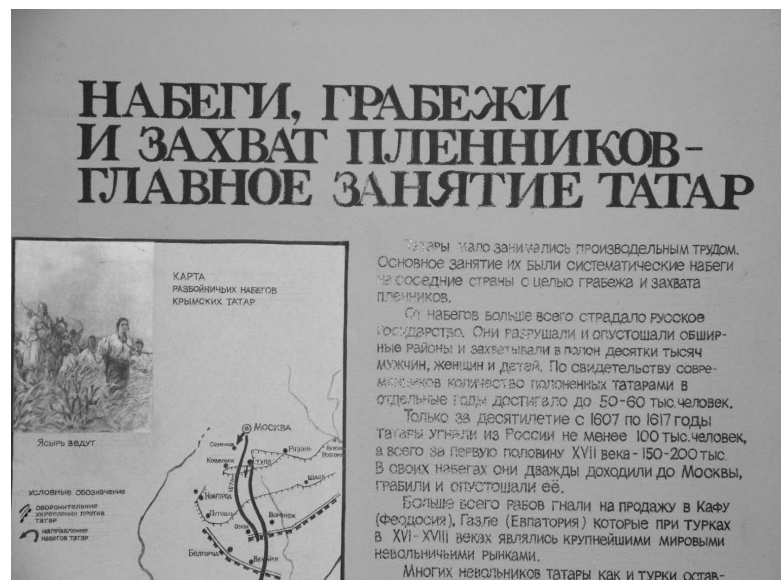
Сучасна експозиція у Нижньогірському краєзнавчому музеї

вив національній ініціативній групі у допомозі в клопотанні перед Хрущовим щодо реабілітації та повернення кримських татар до Криму (і згодом отримав квартиру у Волгограді).