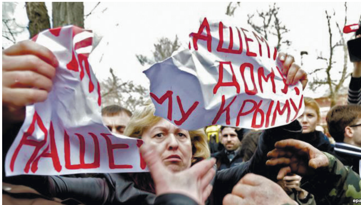
Проросійські активісти нападають на жіночу акцію біля штабу ВМС України в Сімферополі, 5 березня 2014 року

Одного ранку, вже після референдуму, до КПП частини приїхало кілька великих автобусів з «казачками». Однак після мітингу та піару на пресу вони поїхали. Взагалі, тоді на кримських дорогах часто можна було побачити автобуси чи маршрутні таксі, набиті людьми в різно-