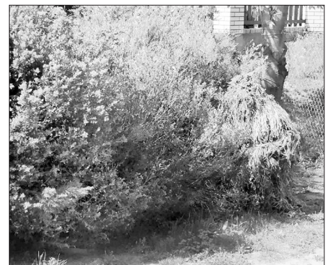
Ефективність своїх маскувальних костюмів волонтери перевіряли у природних умовах

Потім знайомий мого сина попросив, щоб ми виготовили кікімору. Разом з його майбутньою тещею і дівчиною ми за 8 годин сплели першу кікімору з його старого кітеля, пластикової сітки та порізаних на стрічки зелених светрів. І вона 2 місяці йому відслужила. Потім він попросив ще одну.