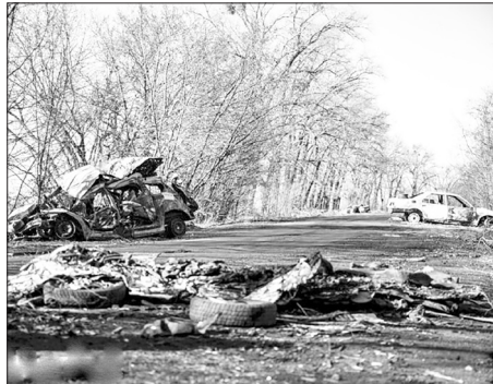
На Київщині під Макаровом.

Танк проїхав, БТР проїхав, і ми покралися до дамби, переїхали міст, побачили потрощені машини, такі ж, як наші, з дітками, яких батьки намагалися евакуювати. Людей повбивали.